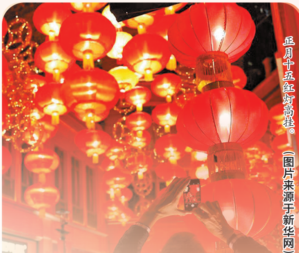
正月十五红灯笼挂满街。

曹建成说,春节期间的各种民俗活动,源于古人对自然的崇拜以及对接下来一年当中所有美好愿景的祈盼和祝福,饱含着古人对天地人的敬畏之心和天人合一的智慧思想。