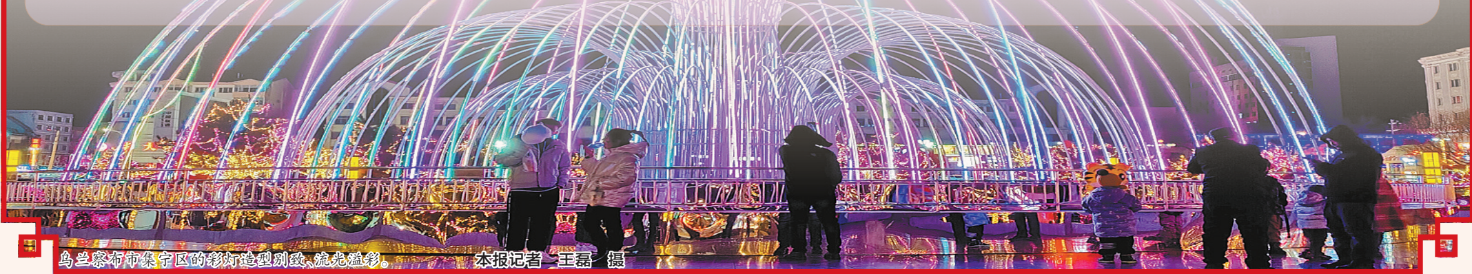
乌鲁木齐市集宁区的彩灯造型别致、流光溢彩。

今年的元宵节,呼和浩特市在做好疫情防控的前提下,从正月初八开始至正月十五,在“第十五届塞上老街非遗庙会暨敕勒川元宵节花灯音乐季”上,推出二人台、相声、马头琴音乐、布艺、剪纸、面塑、腰鼓、茶汤等20多种国家级、省级和市级的非遗项目,不仅丰富了元宵节的活动内容,还为传承弘扬中华优秀传统文化搭建了平台。这种做法,值得提倡。