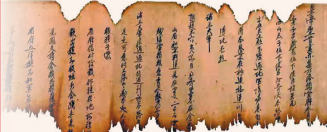
《大德四年军用粮钱文卷》局部。