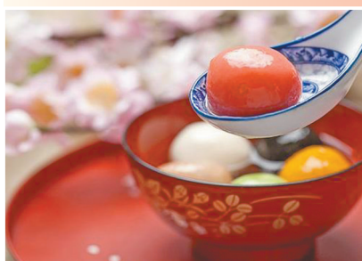
甜甜的汤圆吃起来。