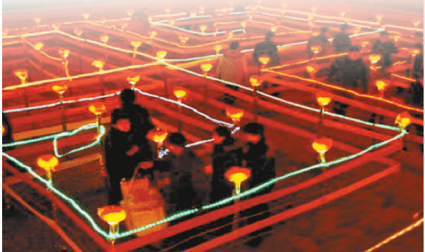
2019年正月十五夜,西水磨九曲灯会游人转九曲。