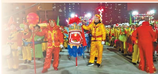
2019年西水磨九曲灯会现场。