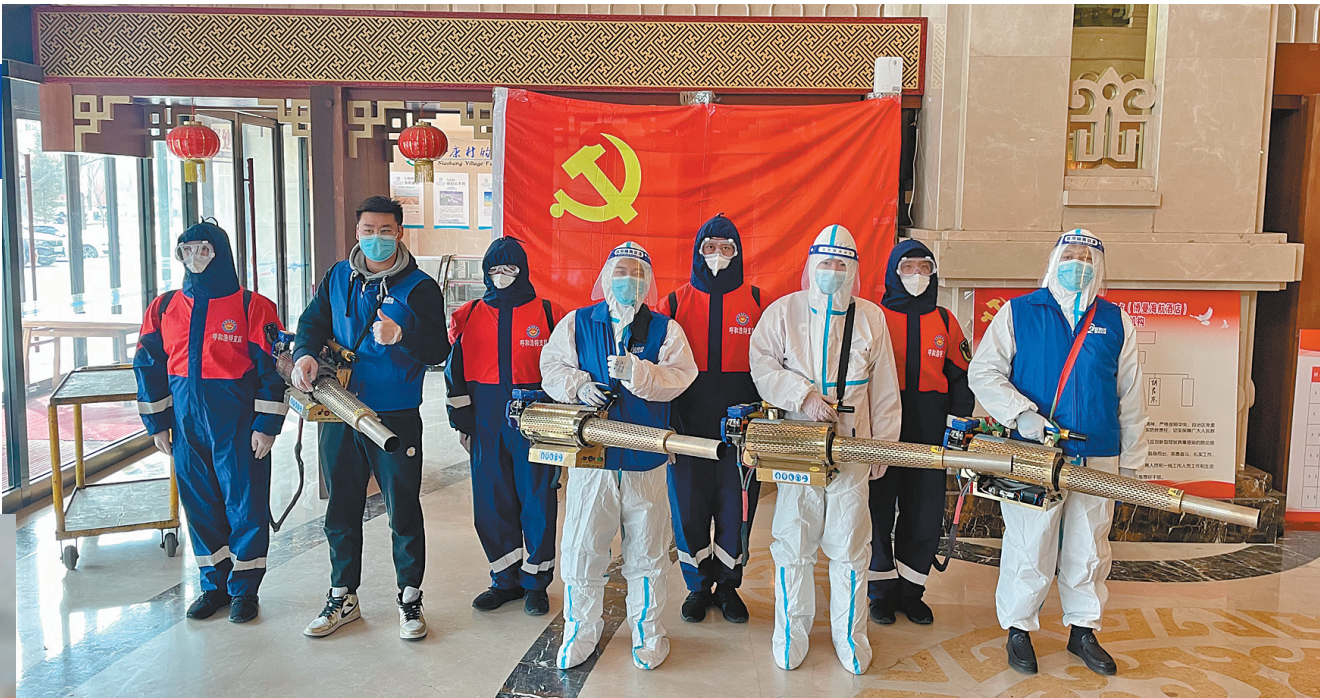
蓝哈达爱心公益组织在进行义务消杀。