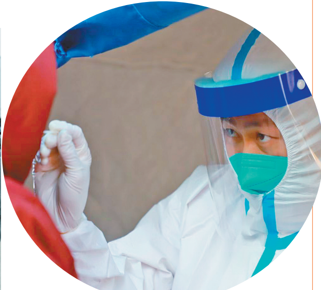
医护人员在为市民进行核酸检测。