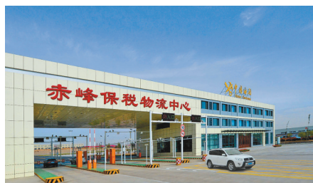
赤峰保税物流中心。