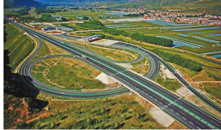
高速公路四通八达。