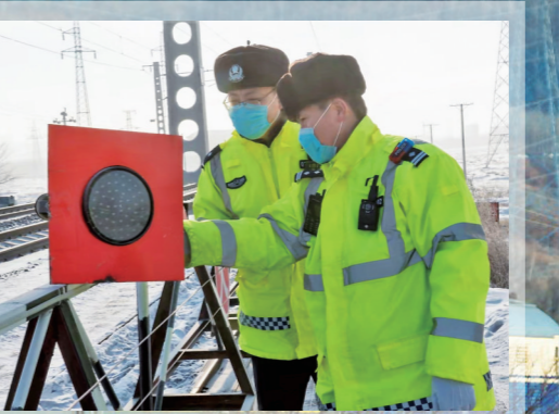
海拉尔铁路公安处交通管理支队民警检查铁路道口安全设施。