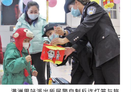
满洲里站派出所民警自制反诈灯笼与旅客互动。