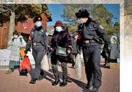
站前派出所民警帮助旅客提拎行李。