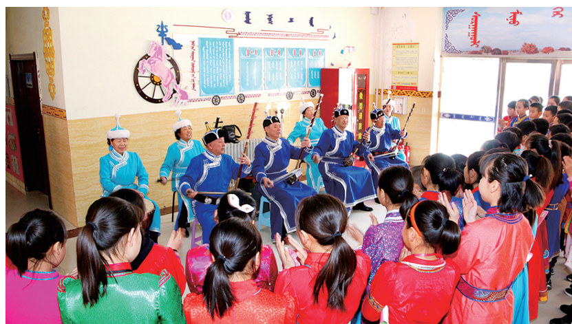
好来宝消防宣传队为学生上了一堂特殊的消防安全课。