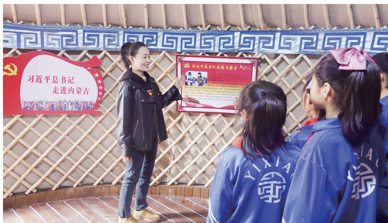
科右前旗乌兰毛都青少年研学基地。