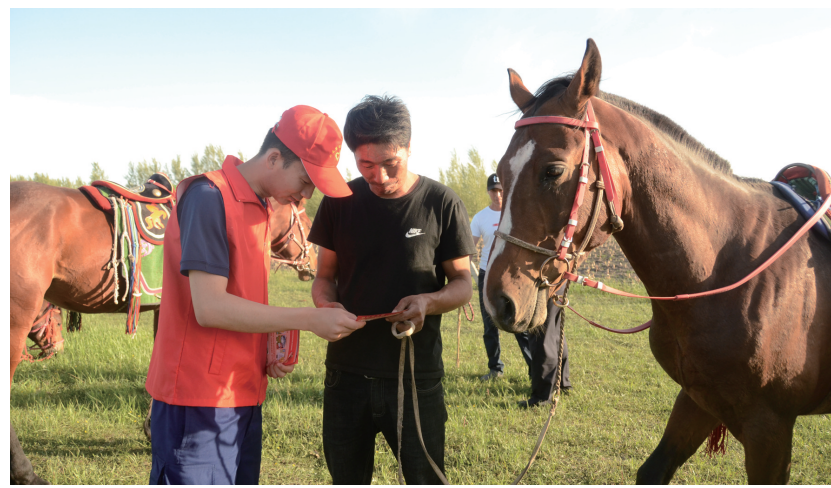
消防志愿者到农牧区为群众讲解消防安全知识。