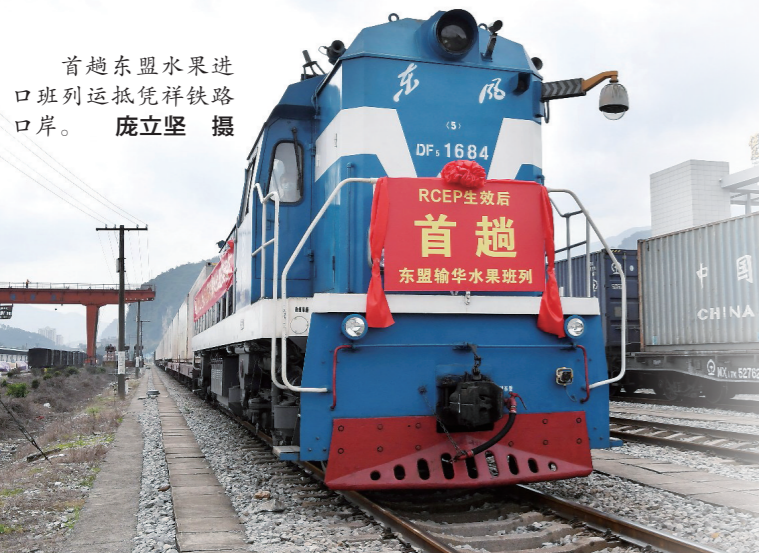
首趟东盟水果进口班列运抵凭祥铁路口岸。

“作为西部陆海新通道重要节点城市,崇左市将抢抓RCEP实施重大机遇,主动融入‘一带一路’和西部陆海新通道建设,加快推进口岸振兴和沿边开发开放步伐,为广西加快形成全方位开放发展新格局提供有力支撑。”广西崇左市委副书记韦朝晖代表表示。