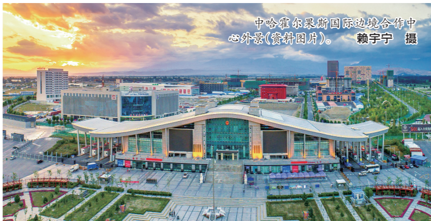
中哈霍尔果斯国际边境合作中心外景(资料图片)。

随着中国向北开放步伐的日益加快,中蒙经贸交流合作不断升级,内蒙古积极发挥区位优势,加快推进“泛口岸”经济发展,主动融入国家“一带一路”建设,截至目前,内蒙古与183个国家、地区牵起了手,“朋友圈”越来越大,合作质量越来越高,发展前景越来越好。去年全年海关进出口总额1235.6亿元,比上年增长17.2%。与“一带一路”沿线国家进出口总额717.3亿元,比上年增长13.2%。