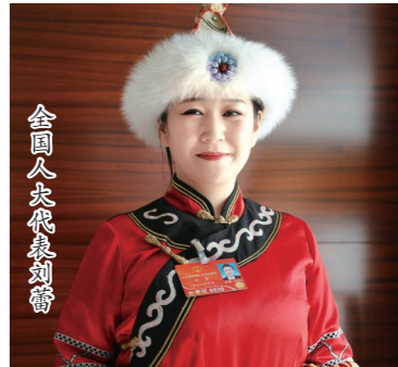
全国人大代表刘蕾

贸易往来的同时,黑龙江沿边开放不断寻求新突破,在祖国的最东端抚远市正推进黑瞎子岛区域湿地生态保护与修复工程。黑龙江正在按照国