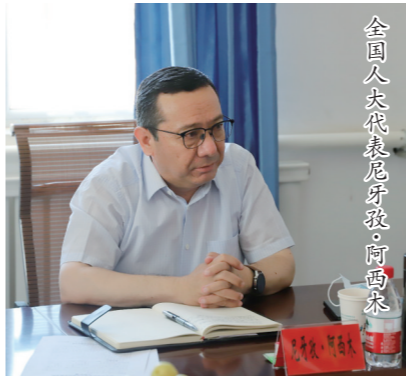
全国人大代表尼牙孜·阿西木

外开放的一个缩影。近年来,新疆以“一港、两区、五大中心、口岸经济带”为抓手,加快推进丝绸之路经济带核心区建设,着力打造我国内陆开放和沿边开放高地。目前,新疆拥有国家级产业园区23家(含兵团4家)、19个一类口岸、4个综合保税区,形成多层次开放平台体系。以霍尔果斯为代表的口岸城市,开放步伐越迈越大,处处呈现勃勃生机。