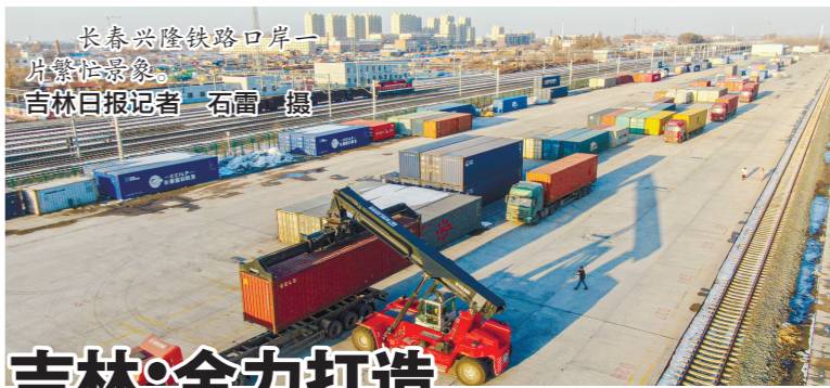
长春兴隆铁路口岸一片繁忙景象。

就像刘蕾说的那样,开放也是黑龙江的比较优势。“十四五”期间,黑龙江将在全国发展的大背景下考量黑龙江的发展定位,在国家区域发展的战略中来谋划黑龙江未来的产业蓝图。黑龙江必将会融入更大格局,走向更大开放。