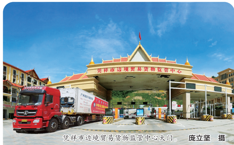
凭祥市边境贸易货物监管中心大门。

在2022年全国两会期间,内蒙古日报社与黑龙江日报社、吉林日报社、广西日报社、新疆日报社共同策划推出“边疆,开放的前沿”重大主题报道,共同畅谈沿边开发开放更上层楼!