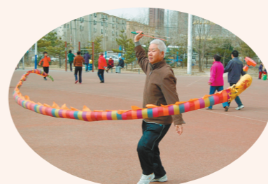
哈尔滨那在练习空竹龙。

空竹,他这么多年来从来没有过感冒。抖空竹是一种人生哲学,空竹玩我,我玩空竹,练习时,人要尊重抖空竹的规律,要用平和的心态来对待它,就像人在社会上要遵守社会的规矩,在学校里要遵守学校的规章制度,一切都要做到顺其自然。