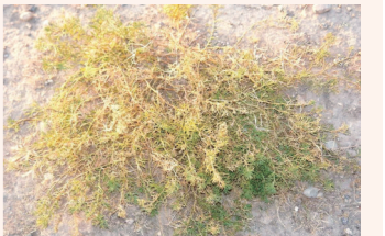
辽上京皇城内的骆驼蓬草。