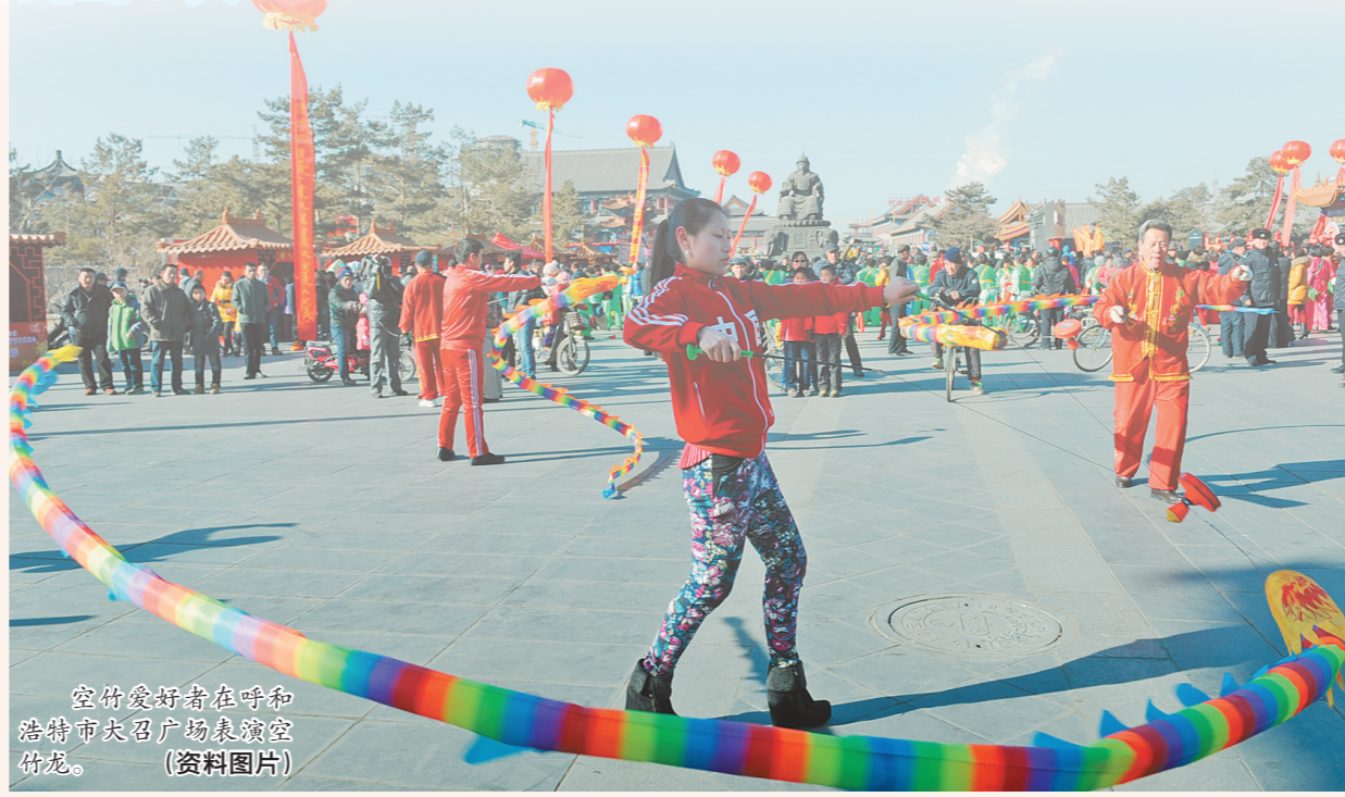
空竹爱好者在呼和浩特市大召广场表演空竹龙。(资料图片)