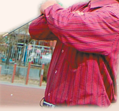
空竹爱好者在表演高杆空竹。

记者在采访中了解到,随着人民生活水平的不断提高,大家对健康生活方式的追求也不断升级。在自治区各地,越来越多的体育爱好者加入抖空竹的行列,有的空竹爱好者还到外地参加抖空竹比赛。有的地区组织开展的抖空竹比赛也吸引了其他省市的抖空竹爱好者参与。由乌兰察布市民政局老龄办和乌兰察布市老年空竹运动协会共同主办的乌兰察布市第三届老年空竹艺术节,就吸引了来自该市及北京、天津、大同、张家口等地的近300名空竹爱好者。大家在参与比赛中,不仅增进了彼此之间的交流,提升了技艺,还为繁荣发展内蒙古经济、弘扬内蒙古文化做出了积极贡献。