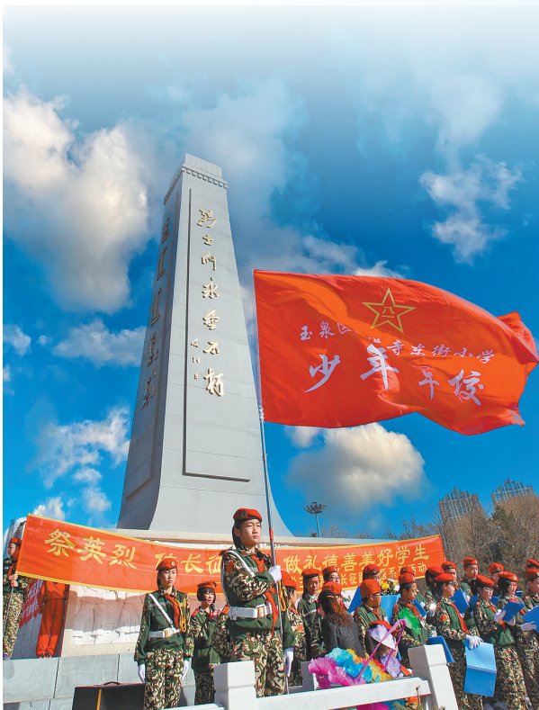
赓续血脉,缅怀英烈。