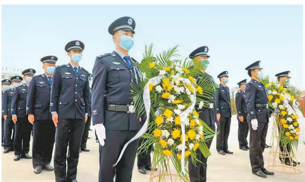
锡林郭勒边境管理支队民警在革命烈士陵园缅怀英烈。

《全国年节及纪念日放假办法》的决定,其中规定清明节放假1天;2008年,清明节正式成为法定节假日,放假1天;2009年,清明节假期包括调休改为3天。