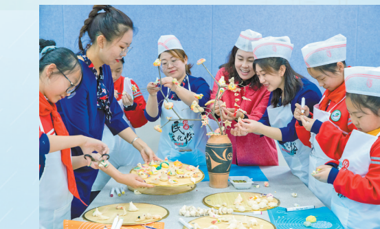
共聚一堂捏寒燕。

高雁萍小时候的场景一直在延续。2021年清明节期间,呼和浩特市南茶坊小学开展了“清明时节寒燕炫彩”主题活动,同学们在民间艺人的指导