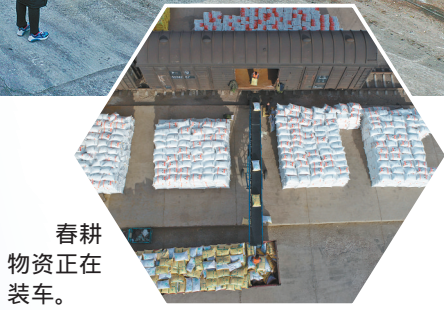
春耕物资正在装车。