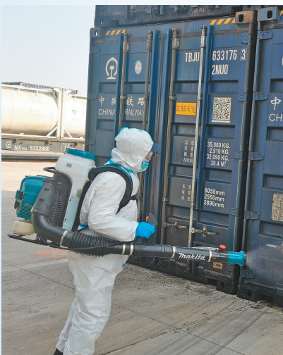
对集装箱进行消杀工作。