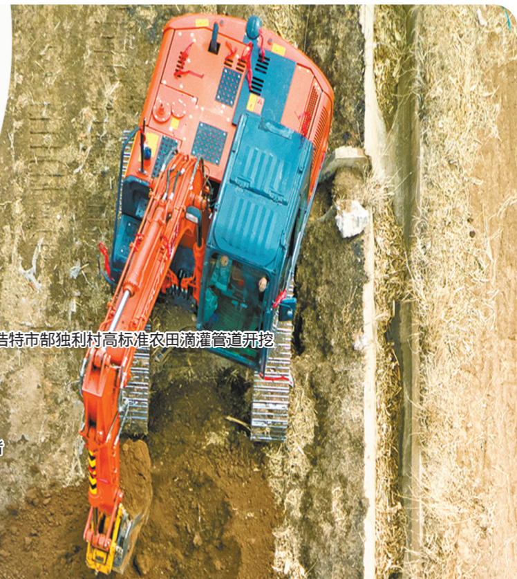
呼和浩特市敕勒村高标准农田滴灌管道开挖