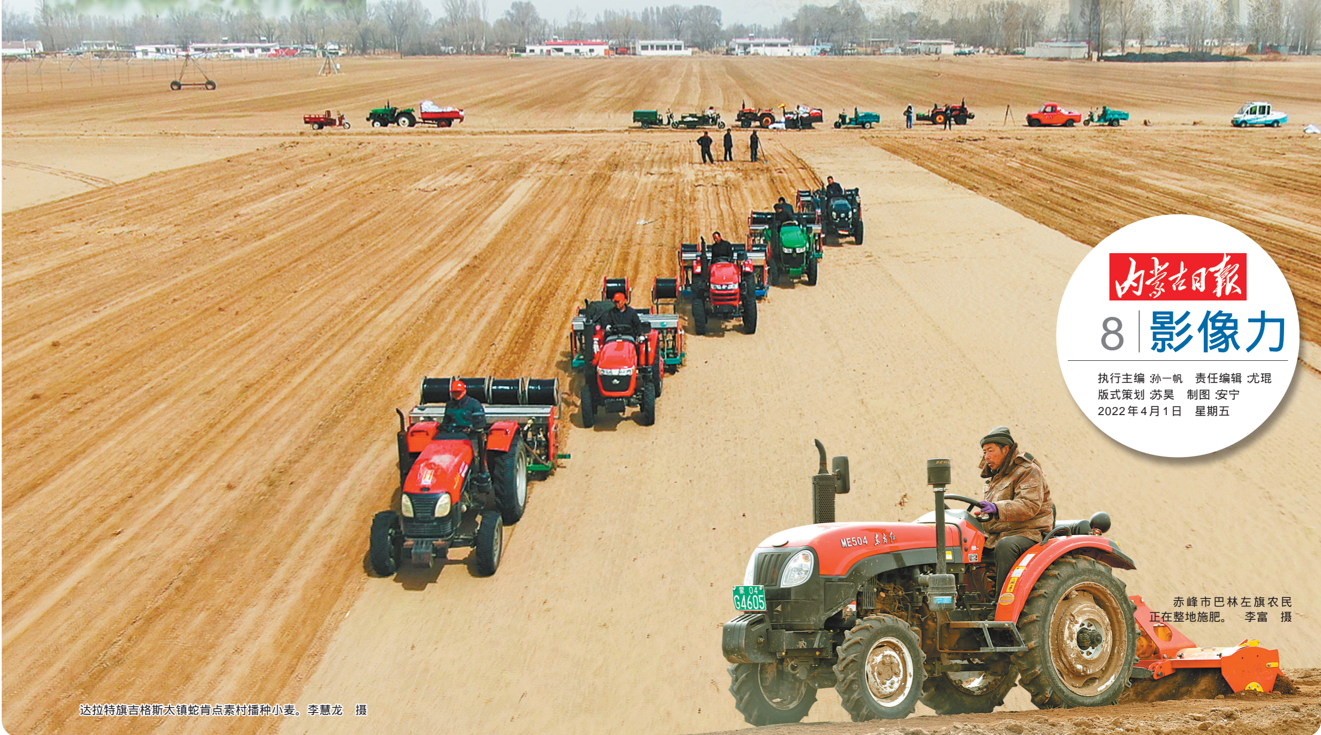
达拉特旗吉格斯太镇蛇窝点素村播种小麦。