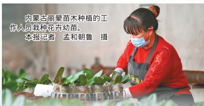
内蒙古丽馨苗木种植的工作人员栽种花卉幼苗。