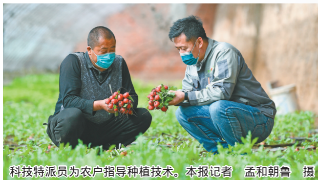
科技特派员为农户指导种植技术。