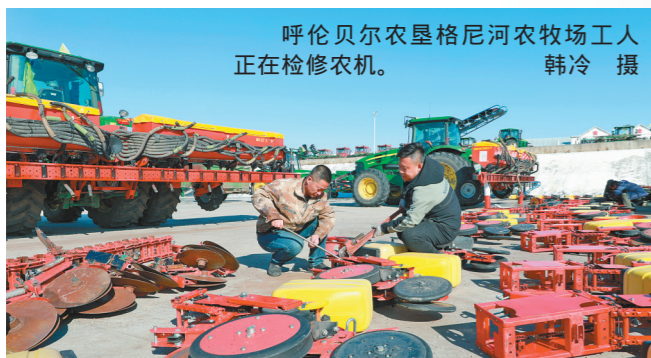
呼伦贝尔农垦格尼河农牧场工人正在检修农机。