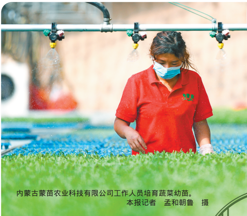
内蒙古苗农业科技有限公司工作人员培育蔬菜幼苗。