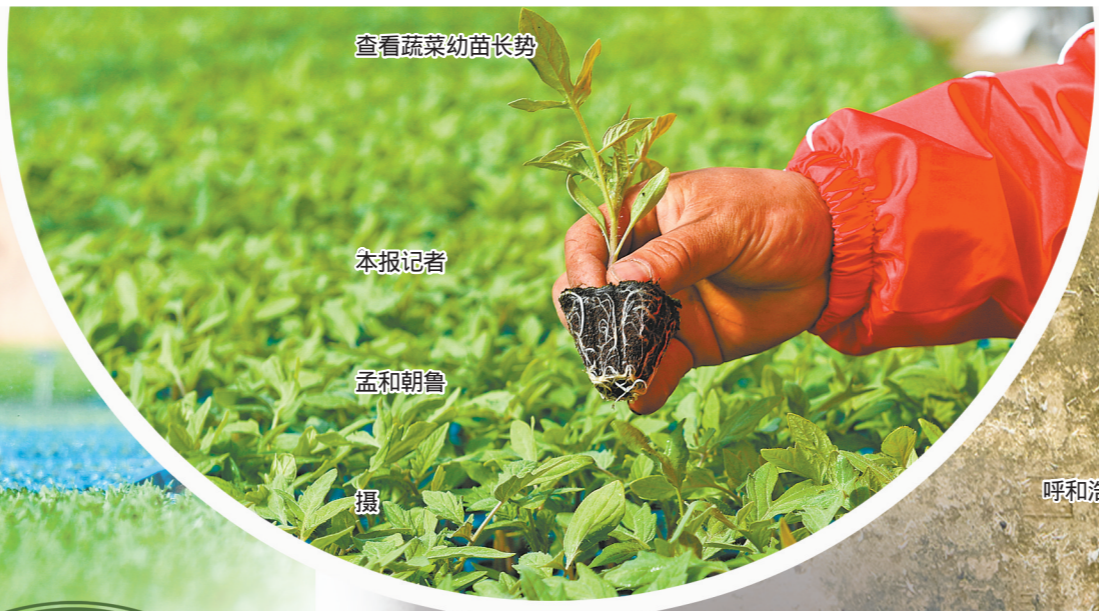
查看蔬菜幼苗长势