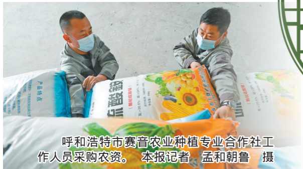
呼和浩特市赛音农业种植专业合作社工作人员采购农资。本报记者 孟和朝鲁 摄