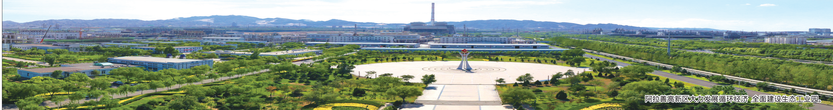
阿拉善高新区大力发展循环经济 全面建设生态工业园。

近年来,阿拉善高新区深入贯彻习近平总书记关于人才工作的重要论述精神,坚持把人才作为高质量发展的第一资源,把人才工作摆在更加突出的位置,大力实施人才强区战略,不断构建人才引育体系,完善人才服务体系,创新打出引、育、用、留四横四纵人才品牌组合拳,为打造高质量发展人才聚集高地、搭台铺路,为经济社会发展插上翅膀、装上引擎,实现了人才发展与产业发展同向发力、同频共振,推动了该高新区工业经济和工业园区高质量发展。