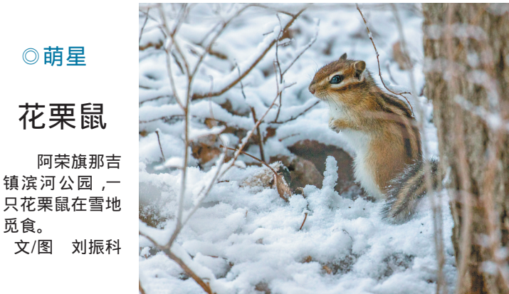
◎萌星 花栗鼠 阿荣旗那吉镇滨河公园,一只花栗鼠在雪地觅食。