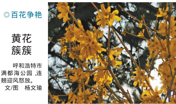
◎百花争艳 黄花簇簇 呼和浩特市满都海公园 连翘迎风怒放。