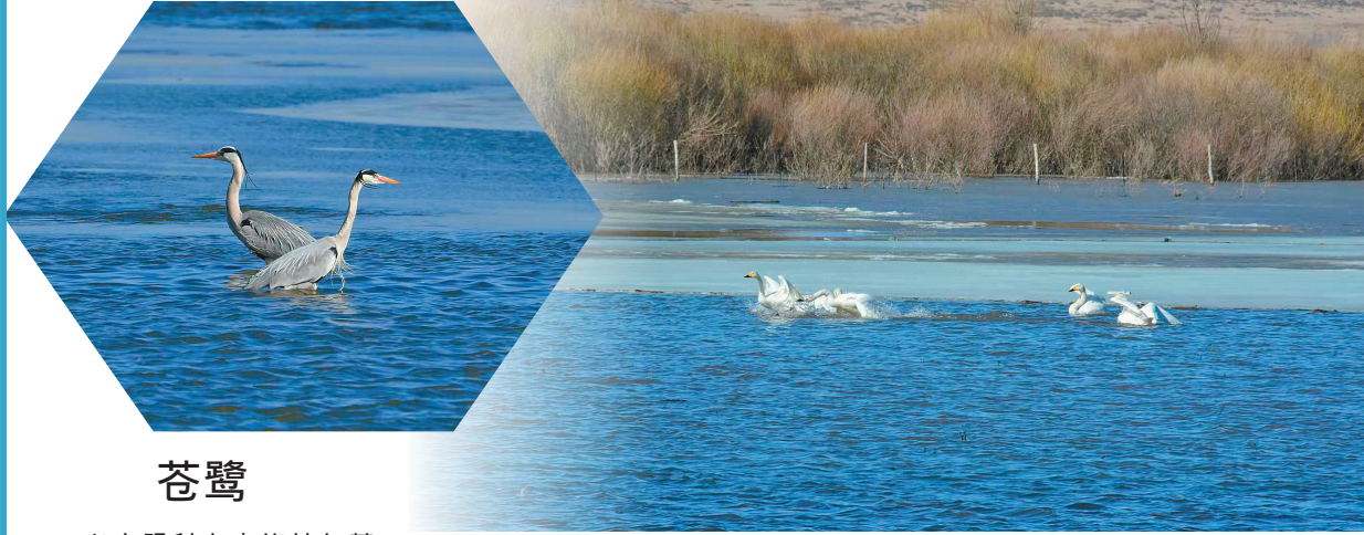
苍鹭 兴安盟科右中旗杜尔基镇 苍鹭在水中觅食。