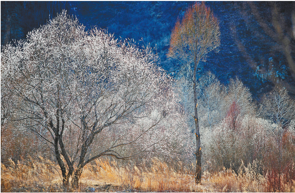
◎四季 银花满树 牙克石市巴林旅游区 红柳花开 洁白似雪 银光满树。