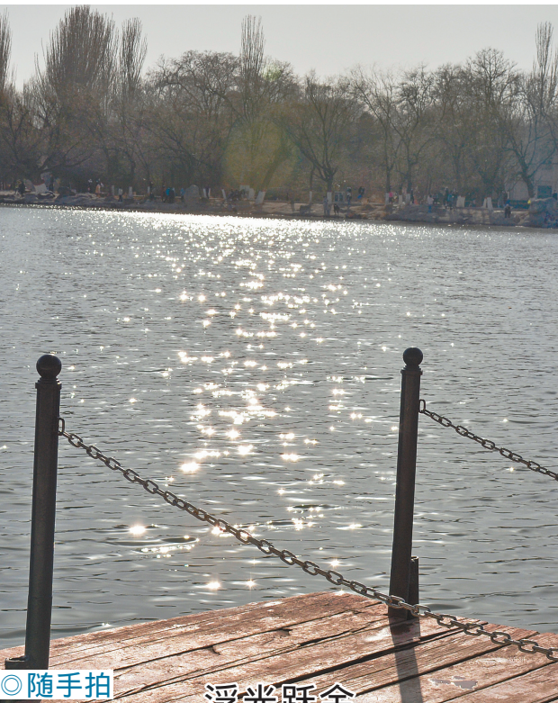
◎随手拍 浮光跃金 呼和浩特市青城公园人工湖 春风轻抚 浮光跃金 湖畔游人 信步徐行 夹道桃花含苞待放 春色宜人。