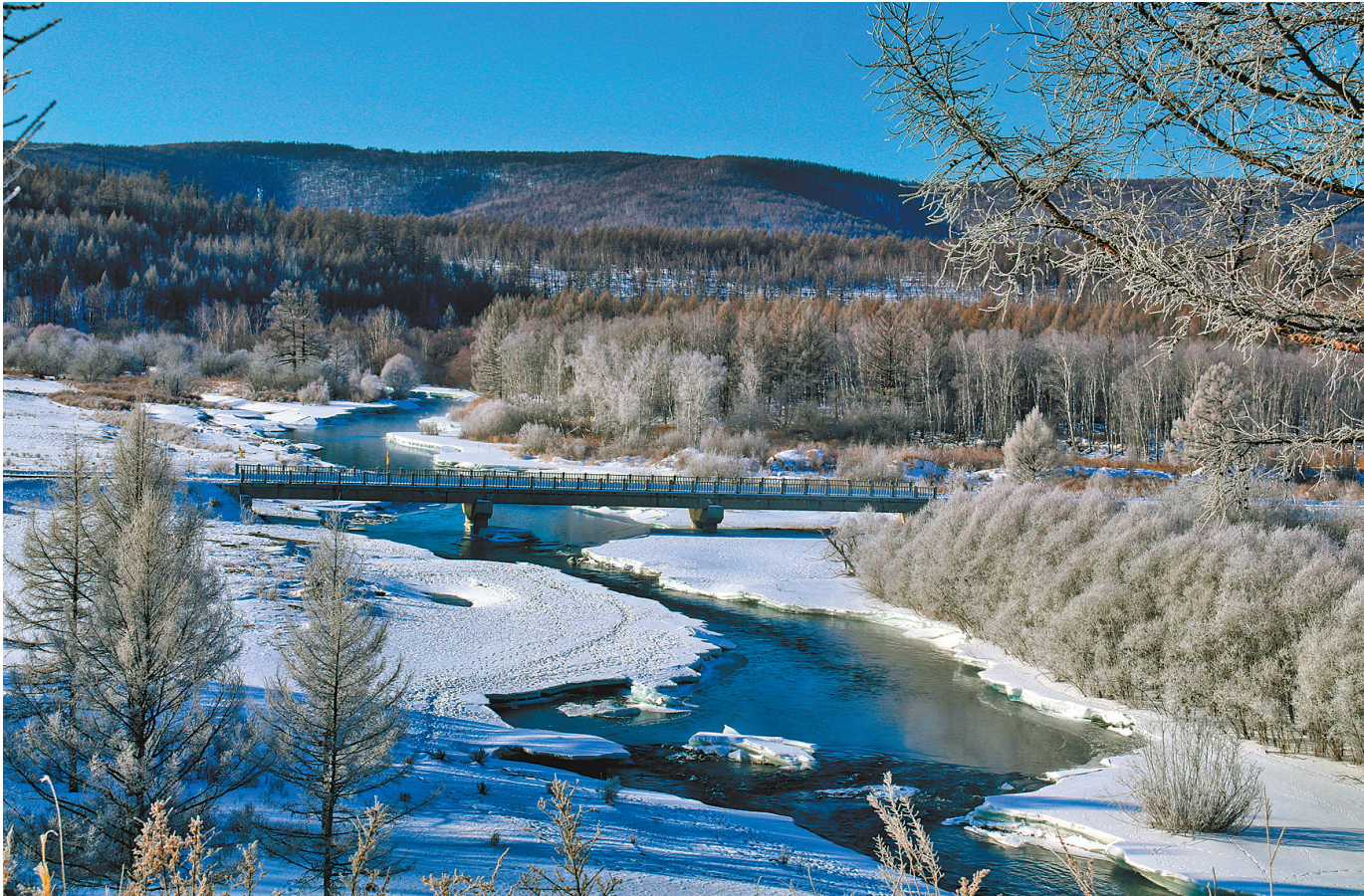
◎江山 哈拉哈河 阿尔山哈拉哈河 冰雪消融 流水潺潺 岸树凝霜 春寒料峭。 文/图 德志纯