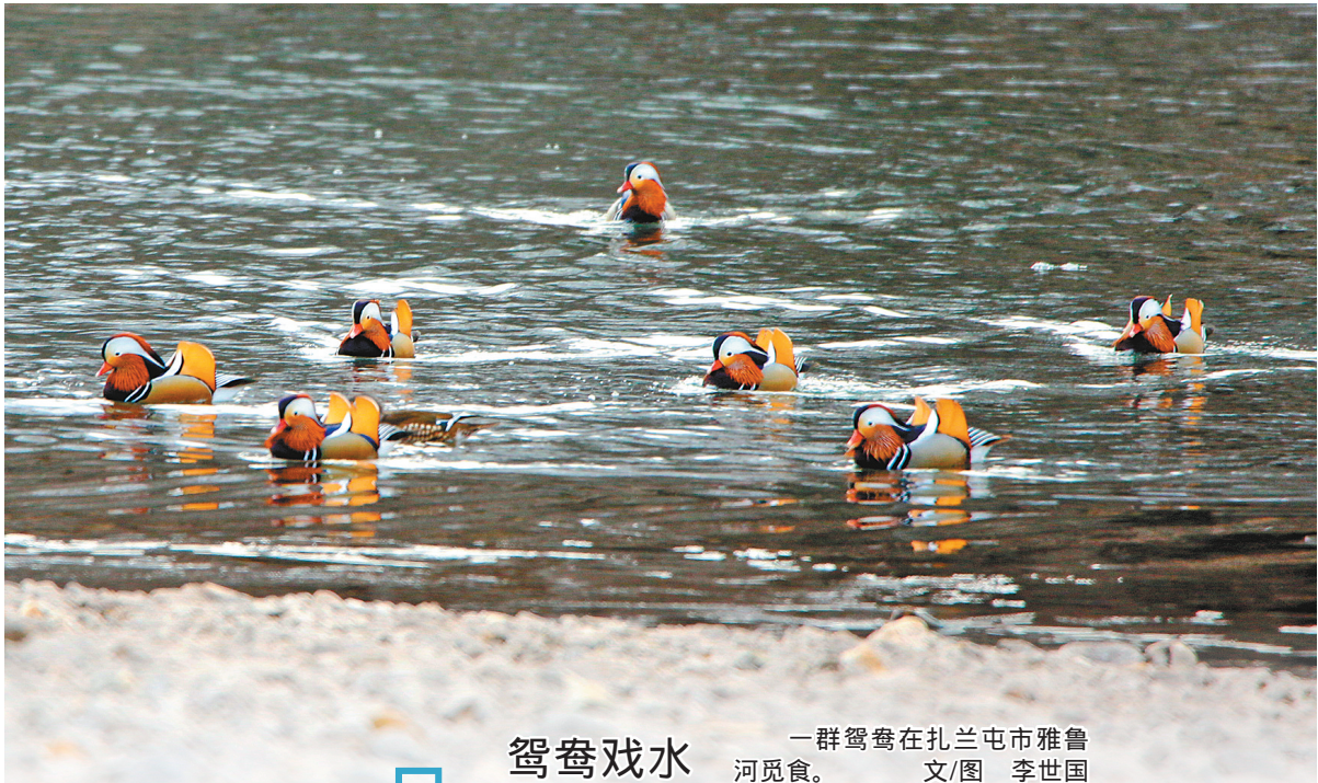
鸳鸯戏水 一群鸳鸯在扎兰屯市雅鲁河觅食。 文/图 李世国