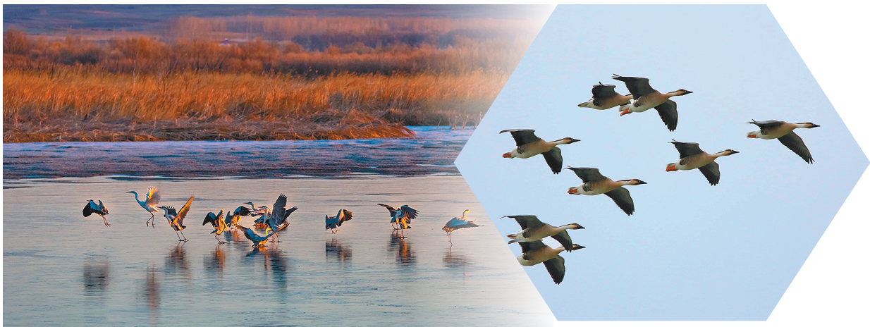
起舞弄清影 内蒙古科尔沁国家级自然保护区 (位于兴安盟科尔沁右翼中旗) 一群灰鹤在冰面起舞。