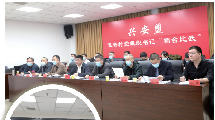
兴安盟盟旗乡三级逐级开展 嘎查村党组织书记 擂台比武 活 动,评选 担当作为好支书。