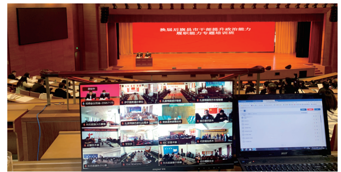
兴安盟举办换届后旗县市干部提升政治能力履职能力专题培训班。