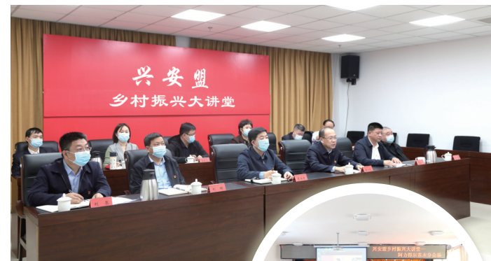
兴安盟开办乡村振兴大讲堂。