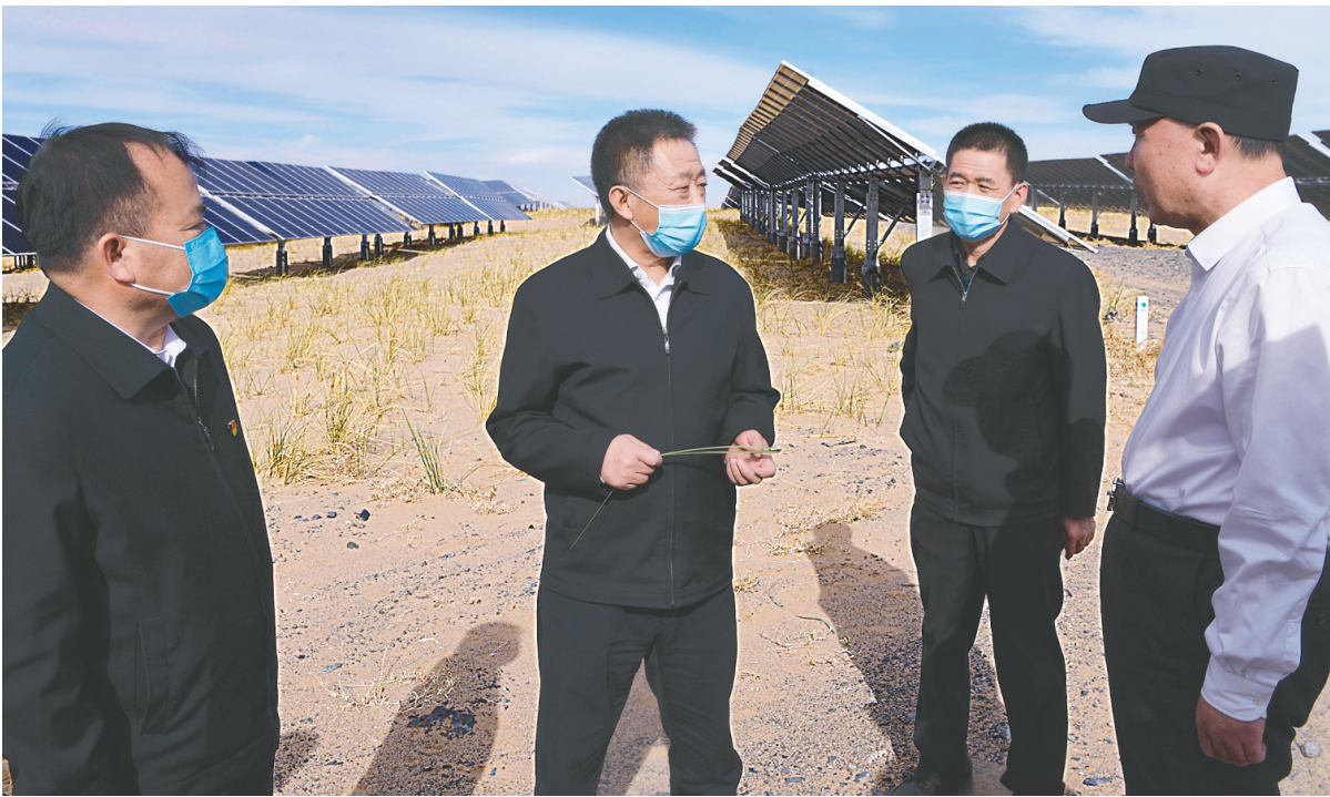
5月17日,自治区党委书记孙绍骋考察阿拉善左旗内蒙古巴音新能源有限公司新能源基地建设及光伏治沙情况。