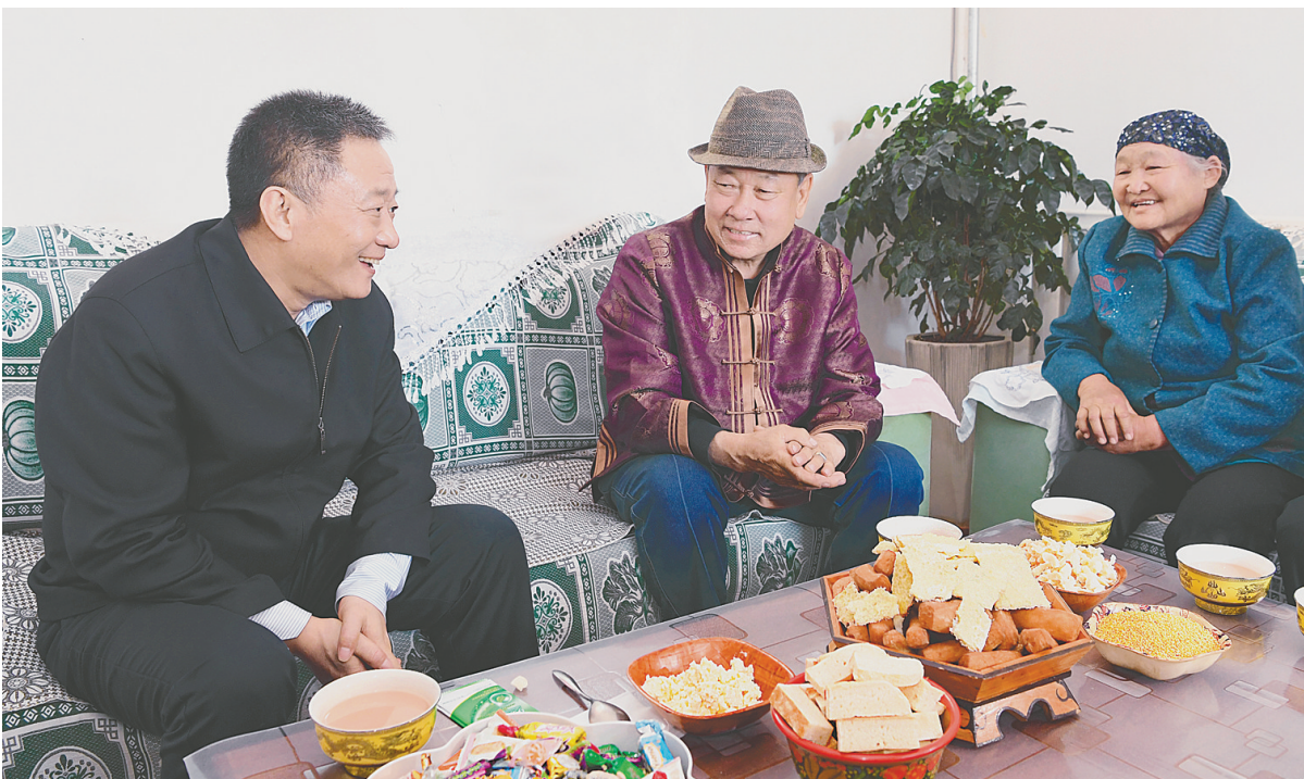
5月16日,自治区党委书记孙绍骋深入阿拉善盟额济纳旗巴彦陶海苏木乌苏荣贵嘎查,走访牧民群众。

本报5月18日讯 (记者 刘晓冬)5月15日至18日,自治区党委书记孙绍骋深入额济纳旗、阿拉善右旗、阿拉善左旗调研口岸疫情防控、新能源建设、乡村振兴、生态保护等工作。 孙绍骋首先来到策克口岸联检大楼,围封作业区,深入了解口岸建设管理、恢复通关准备和疫情防控情况。他强调,要抓紧做好通关各项准备工作,争取早日全面开放,严格落实“三道防线”防控措施,确保口岸运行和疫情防控万无一失。 孙绍骋走访乌苏荣贵嘎查牧民、额肯呼都格嘎查致富带头人和巴音陶海苏木机关,与干部群众深入交流,详细了解农牧民生产生活情况。家里有多少亩草场,能领多少补贴,民宿旅游收入占比多大,还有哪些收入来源,在牧民家里,孙绍骋与大家一笔笔算起收入账。了解到当地农牧民收入有来源、致富有门路,生活有奔头,孙绍骋十分欣慰,祝愿他们日子越过越红火。 新能源建设是此次调研的重点。孙绍骋走进苏泊淖尔光伏电站、五凌电力公司、巴音新能源公司项目现场,听取项目建设情况介绍,察看光伏治沙效果。投资额是多少、占地面积有多大、土地租赁是什么标准、利税和效益怎么样,每到一处他都问得非常详细。孙绍骋强调,发展新能源一定要转变方式,不仅讲规模,还要讲效益,积极创新合作模式,不能简单化、图省事,要为子孙后代留下家底。 孙绍骋还来到居延海生态治理区和内蒙古骆驼研究院,深入了解生态保护治理和特色产业 development 情况。 期间,孙绍骋主持召开座谈会,听取阿拉善盟和自治区发改委、能源局工作汇报。孙绍骋强调,要紧抓快干、跟踪问效,加快推进各类重大项目建设,力争形成更多实物量。要有效统筹新能源建设发展,有什么问题就抓紧解决什么问题,着力打通各类堵点,不能等和拖,确保尽快形成优势产能。要坚决扛起保护生态环境的重大责任,上项目必须坚持生态优先、绿色发展为导向,保持战略定力,不能搞“捡到篮子里都是菜”那一套,决不能干砸子孙后代碗、断子孙后代路的事情。要切实增强节约意识,充分利用好土地、水、能源等各类生产要素,每一点资源都不能浪费,着力改变简单粗放、不重效益的观念和做法。要压实责任、强化考核,推动各级有力有序做好债务化解工作。 自治区领导黄志强参加座谈会,于立新参加活动。