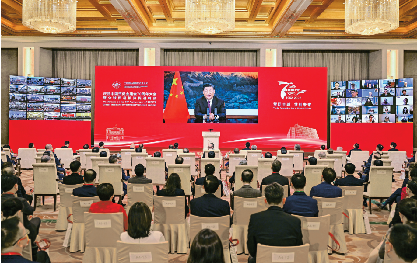
5月18日,国家主席习近平在庆祝中国国际贸易促进委员会建会70周年大会暨全球贸易投资促进峰会上发表视频致辞。

他,以公平正义为理念引领全球治理体系变革。 习近平强调,中国扩大高水平开放的决心不会变,中国开放的大门只会越开越大。中国将持续打造市场化法治化国际化营商环境,高水平实施《区域全面经济伙伴关系协定》,推动高质量共建“一带一路”,为全球工商界提供更多市场机遇、投资机遇、增长机遇。让我们携起手来,坚持和平、发展、合作、共赢,共同解决当前世界经济以及国际贸易和投资面临的问题,一起走向更加美好的未来。(致辞全文另发)