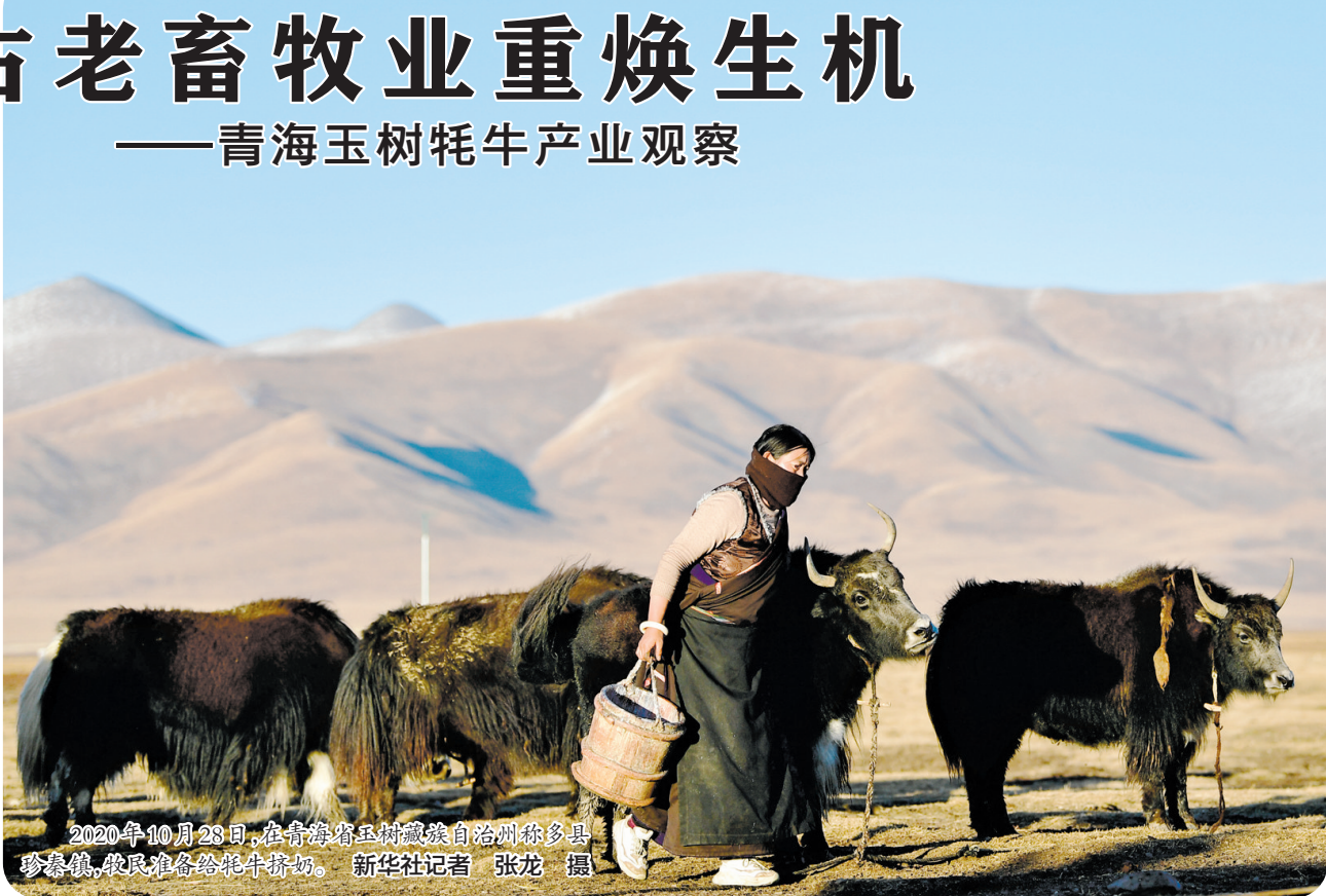
2020年10月28日,在青海省玉树藏族自治州称多县歇武镇,牧民准备给牦牛挤奶。

午后的称多县歇武镇牧业村,阳光洒遍大地。一座现代化养殖基地里,白玛代西和丈夫推出3袋饲草料,倒入食槽,引来牦牛争相进食,“这个冬天,棚