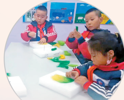
新巴尔虎左旗阿木古郎第一小学开设了巴尔虎传统制毡及搓毛绳技艺兴趣班。

工作站新巴尔虎左旗分站”,目前该工作站培训所拥有毡艺传承人、手工艺人、毡艺爱好者60余名。工作站采取以传承传统制毡及搓毛绳技艺、传统针法为主的老一辈传承人为代表的团队,和由文化馆馆员、各校美术老师、服饰传承人等组成的,面向旅游市场制作毡绣旅游创意产品为主的新一辈手工艺团队相结合的运营模式,全面推进技艺的传承,特别是在进校园项目实施过程中,传承人定期进校园,在小学成立的兴趣班上课,当地各部门齐抓共管,巴尔虎制毡及搓毛绳技艺进校园取得阶段性成果。