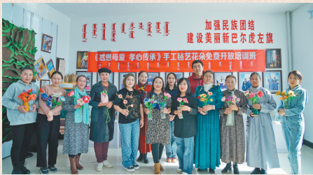
2022年新巴尔虎左旗文化馆免费开放的“孝心传承”毡艺花朵制作培训班学员与老师合影。