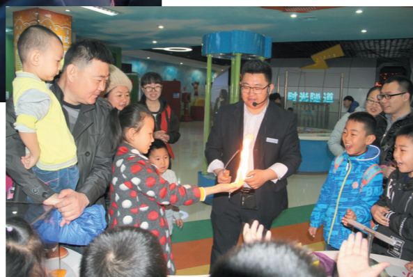
巴彦淖尔市青少年科技馆组织学生开展科普体验活动。