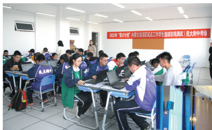
2022年内蒙古自治区英才计划学生选拔在线测试。

这些优秀的科技工作者把以爱国和创新为底色的新时代科学家精神融入到自己的工作当中，始终保持对科技事业的热爱和专注，不慕虚荣、不计名利，把论文写在祖国大地上。