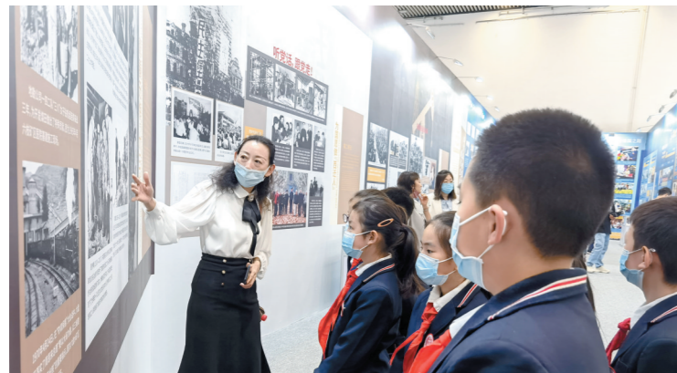
内蒙古科技馆与呼和浩特市新城区苏虎街实验小学联合开展礼赞科学家馆校结合活动。

此外，还大力开展青少年科学影像节、青少年科学调查体验活动等一系列科技教育活动，以实际行动助力“双减”。