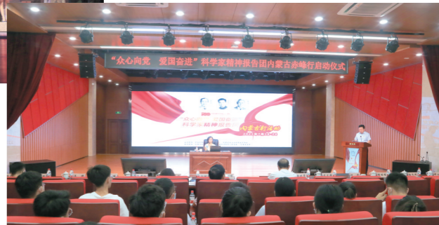
内蒙古科协举办的科学家精神报告会走进赤峰。