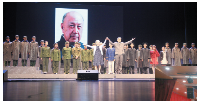
内蒙古科协举办的共和国的脊梁——科学大师名校宣传工程科学家主题话剧《钱学森》呼和浩特演出现场。

一项项创新成果竞相涌现，破难点、除痛点、通堵点，我区创新能力持续提升，有效助力高质量发展。