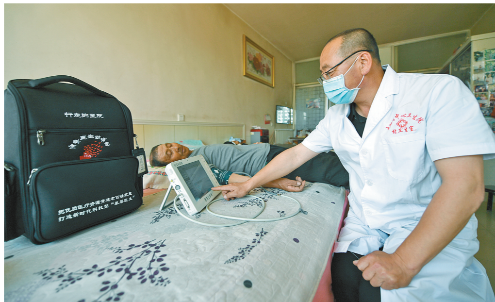
入户为村民做检查。