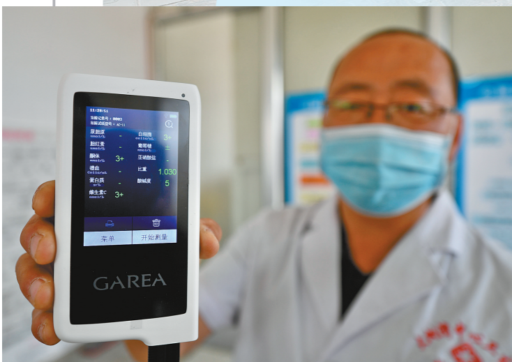
“全科医生助诊包”可提供多种项目检查。

“行走的医院”是由中国初级卫生保健基金会中西部振兴与发展办公室等发起的医疗帮扶项目,也是达拉特旗2022年十大民生实事项目之一,让基层医生把优质医疗资源和服务送到农村牧区百姓家里,老百姓足不出户可享受三甲医院专家的诊疗服务。