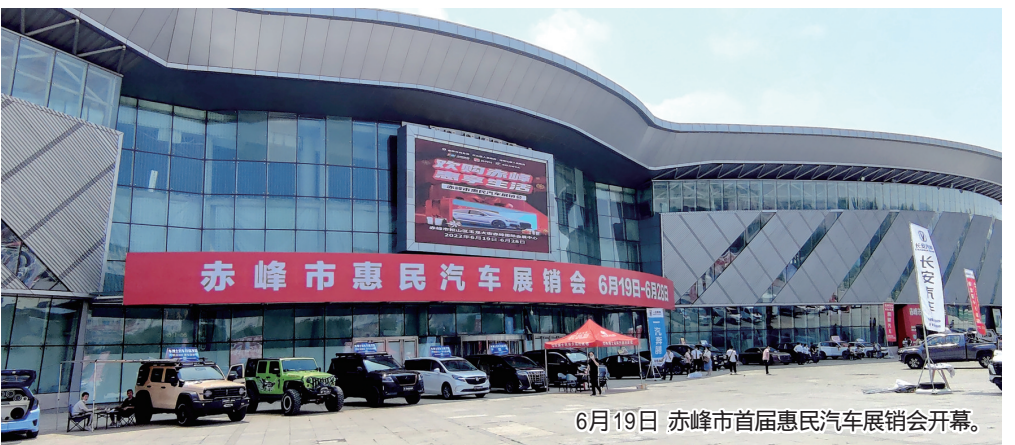
6月19日,赤峰市首届惠民汽车展销会开幕。

费活动之后,落实促消费、扩内需工作部署的又一得力举措,成功营造政府搭建平台、车企让利促销、媒体轰动宣传、全民乐享消费的良好社会氛围,对进一步拉动赤峰汽车消费,丰富城乡居民生活,促进汽车更新换代,挖掘市场潜力具有重要意义。