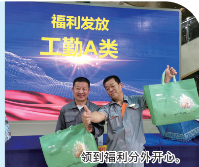
领到福利分外开心。

内蒙古通辽金叶有限责任公司通过工分制改革,实现按劳分配,多劳多得,进行工资协商、薪资调整,同比提升5%,增加季度员工福利,依据员工季度工分排名高低区分A、B、C福利等级,充分利用工会的组织优势,每半年召开一次职工代表大会,健全完善职工代表大会、女职工委员会、劳动保护委员会等工会内部组织,落实工会维护职能,先后制定劳动合同制度、集体合同制度、工资协商制度和劳动争议调解制度,切实维护职工权益,组织员工学习《劳动法》《工会法》等法律法规,增强员工维权意识。