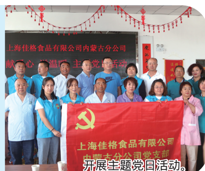
开展主题党日活动。

上海佳格食品有限公司内蒙古分公司党组织和工会组织聚焦党建共建,坚持同步建设、同步学习、阵地共建共享,推动党建共建深入开展,聚焦党建引领,坚持把党的政治建设摆在首位,把做好职工思想政治工作同解决急难愁盼结合起来,把思想引领同“我为群众办实事”结合起来,把职工紧密团结在党周围,聚焦职工同心,始终坚持“以职工为中心”的工作导向,坚持同谋划、同落实、同考核,大力开展劳动竞赛、素质提升、技术创新等活动;通过党建带工建、工建促党建,模式积极推进产业工人队伍建设改革。