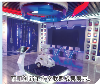
职工创新工作室联盟成果展示。

内蒙古电力(集团)有限责任公司充分发挥人才优势、技术优势和设备优势,在职工创新工作室联盟方面积极探索,推动产改工作取得积极进展。以包头供电公司作为试点单位,成立以主要领导为组长的职工创新工作室联盟组织机构,形成党政支持、工会组织、部门配合、劳模先进和技术能手挂帅、职工广泛参与的工作格局,高度重视科技创新,始终坚持科技兴企和人才强企战略,广泛开展校企战略合作,积极推进劳模和工匠人才创新工作室联盟创建工作,促进产学研深度融合。