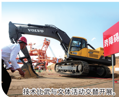
技术比武与文体活动交替开展。

内蒙古第一机械集团有限公司不断健全完善加强和改进职工思想政治工作体制机制。党委主责主抓,把思想政治工作融入生产经营管理、产业工人队伍建设等工作中,让思想政治引领有高度、有广度、有深度,聚焦文化建设,构建“铁骑文化”工作体系,专注典型引领,通过形式多样的活动丰富职工文化生活,全方位听民声,多角度解民难,职工人均工资连续5年保持不低于10%的增长,持续改善职工生产生活环境,组织开展业务标兵、最美家庭等评选,激发职工立足岗位建设世界一流企业的使命感与责任感。