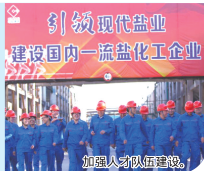
加强人才队伍建设。

中盐内蒙古化工股份有限公司坚持以全面提质增效为目标,进行质量变革、效率变革和动力变革,通过提升产业队伍操作技能,持续提高生产装置的负荷率和开工率,使成本得到控制,产品单位耗费明显降低,产品质量不断提升,企业效益大幅增长,以自主孵化为重点,不断创新化工人才培养机制,形成了以问题导向型培养、能力提升型培养、终身学习型培养为主的创新自主孵化的化工人才培养形式,不断优化职工队伍知识结构和能力结构,提升职工队伍化工专业素养,通过加强人才队伍建设推动企业高质量发展。