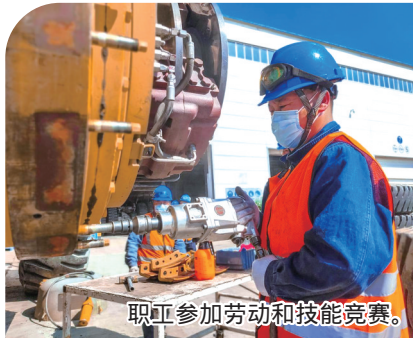
职工参加劳动和技能竞赛。