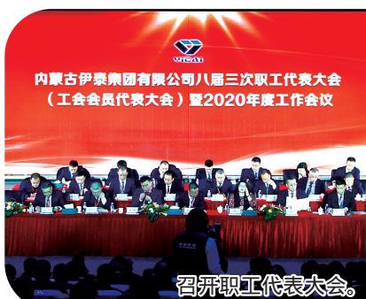
召开职工代表大会。