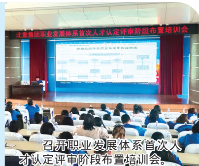
召开职业发展体系首次人才认定评审阶段布置培训会。

内蒙古北方重工业集团有限公司将产改试点任务与人力资源新体系建设相融合,通过“两个规划、三个制定”,即规划核心专业序列、职业发展阶段,制定差异化任职资格标准、职业素养评价标准、多层工作机构,打破职业发展禁锢,设置7层25级职业发展层级,纵向建立起从五级技能工到资深技能大师的职级,形成有序贯通的产业工人职业晋升体系,通过建立规范化的岗位管理体系、可量化的绩效考核体系、专业化的职业发展体系和差异化的薪酬激励体系,规划了覆盖所有专业技术领域的人才梯队建设蓝图。