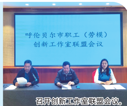
召开创新工作室联盟会议。

呼伦贝尔市总工会积极创建劳模和工匠人才创新工作室联盟,发挥集群效应和联合攻关、协同创新效能,推动经济高质量发展。成立呼伦贝尔市职工(劳模)创新工作室联盟,现有企业自身创建联盟4个,行业示范性联盟1个,跨地区跨行业联盟2个,涵盖劳模(工匠)人才创新工作室46家,抓好合作创新机制,发挥劳模示范引领作用,不断深化提升职工(劳模)创新工作室创建,把工匠人才队伍建设纳入全市人才发展中长期规划,深入实施职业技能提升行动,不断强化工匠人才校企合作体系建设。