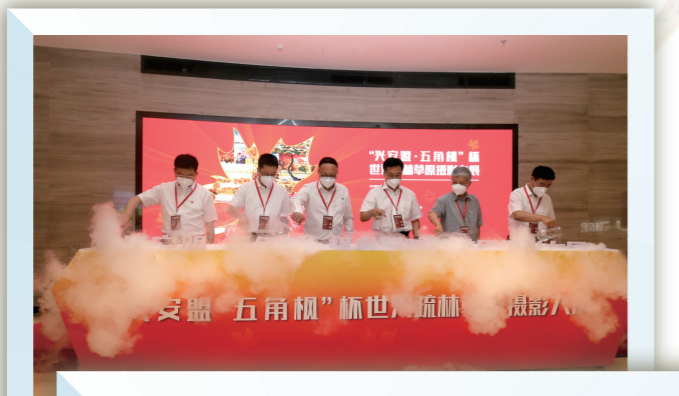
嘉宾为摄影展启幕。

通过此次摄影展,让内蒙古真善美的形象在首都绽放光彩,让社会各界再次领略兴安盟“四季都很美”的自然风光,更加直观地感受到了真善美的内蒙古情怀。