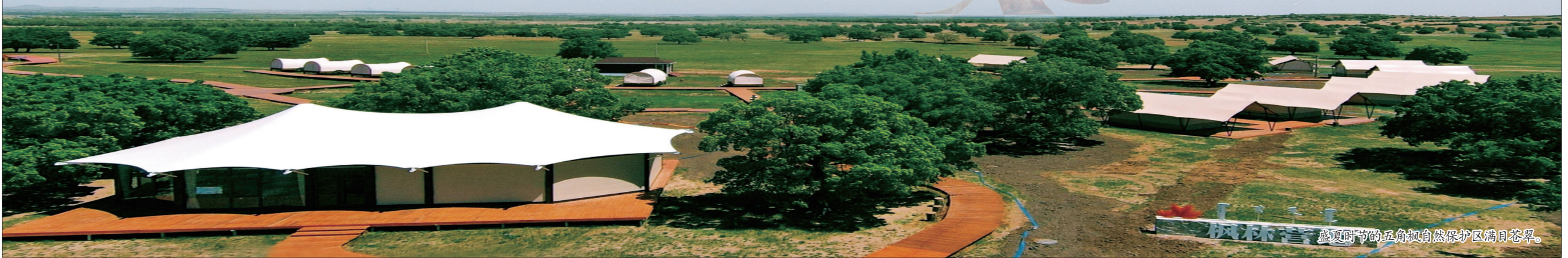
盛夏时节,五角枫自然保护区满目苍翠。