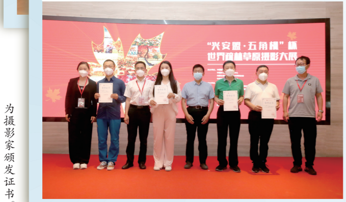
为摄影家颁发证书。