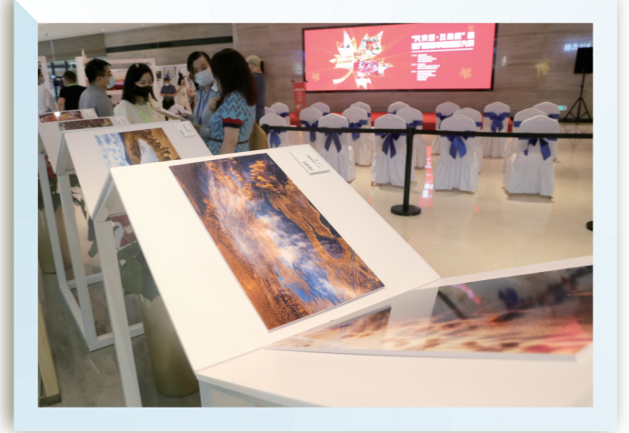
展现兴安盟绿色生态。