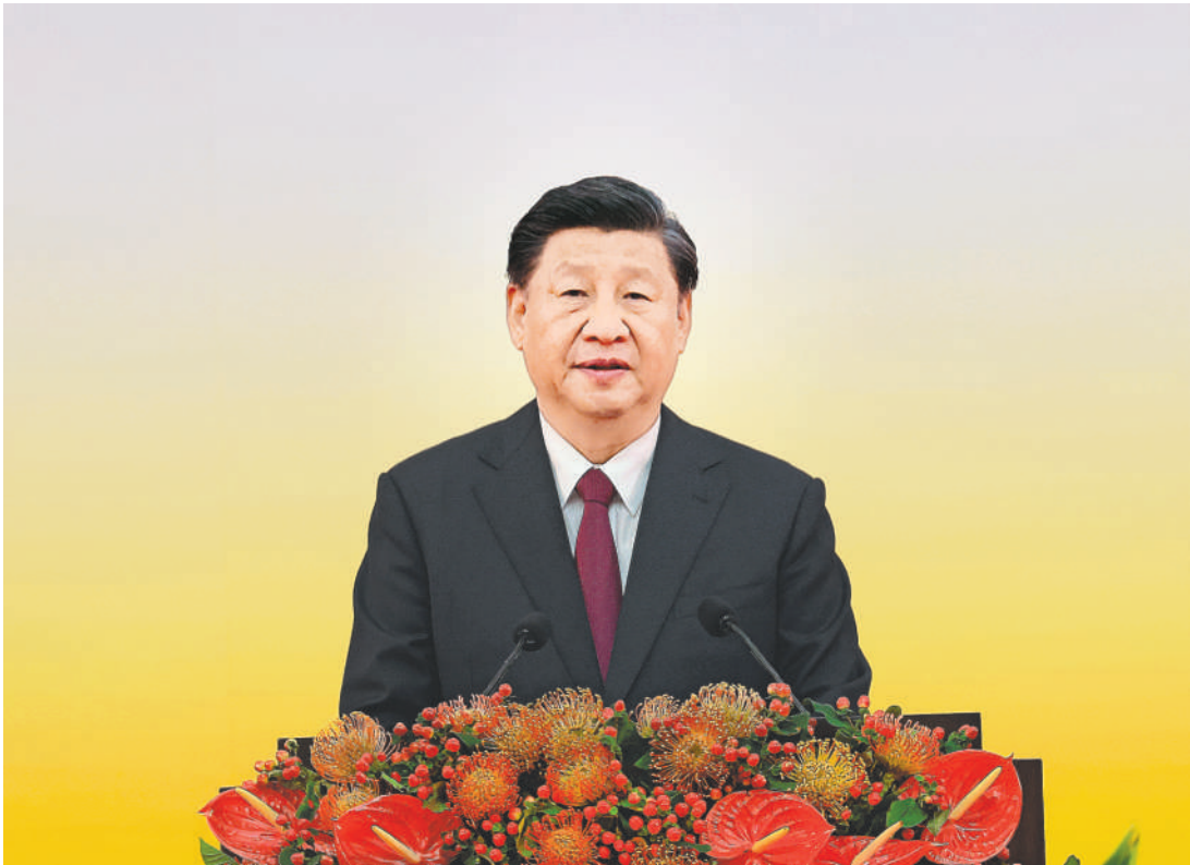
7月1日上午,庆祝香港回归祖国25周年大会暨香港特别行政区第六届政府就职典礼在香港会展中心隆重举行。中共中央总书记、国家主席、中央军委主席习近平出席并发表重要讲话。