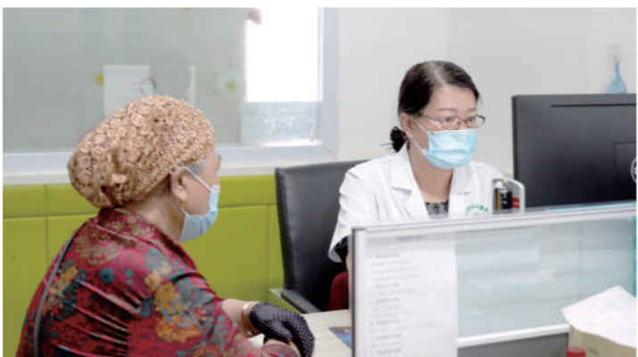
打造一刻钟医疗圈。