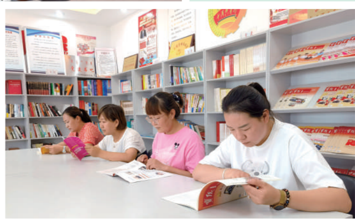
居民在社区图书室内静心阅读。