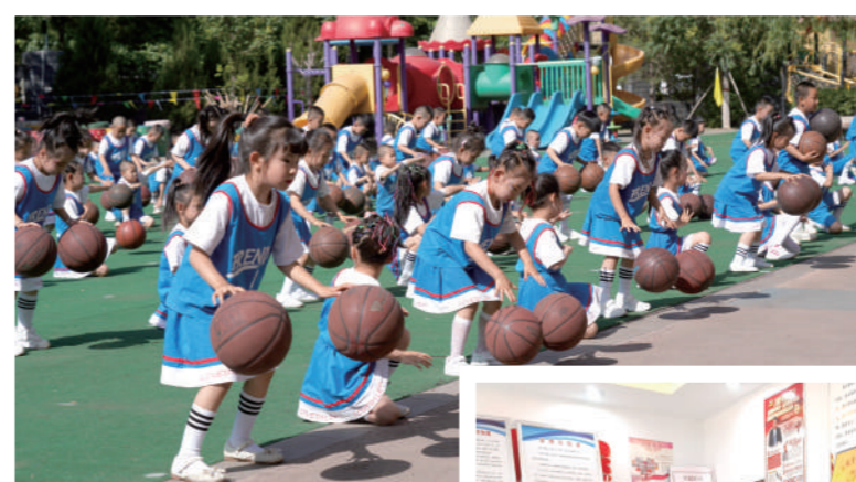
适龄儿童就近入学。

据了解,海南区将按照“试点先行、示范带动、以点带面、全面推开”的步骤,突出便民利民惠民导向,通过三年(2022年—2024年)建设打造“宜居、宜业、宜学、宜养、宜游”的一刻钟社区生活圈。分阶段在全区范围内推广,逐步实现全区社区服务体系便捷化、配套功能设施完善化、业态服务品质多样化、治理模式智慧高效化,增进民生福祉,畅通经济微循环,满足人民群众日益增长的美好生活需要。