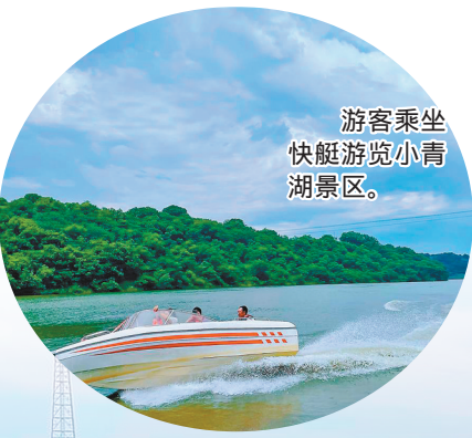
游客乘坐快艇游览小青湖景区。