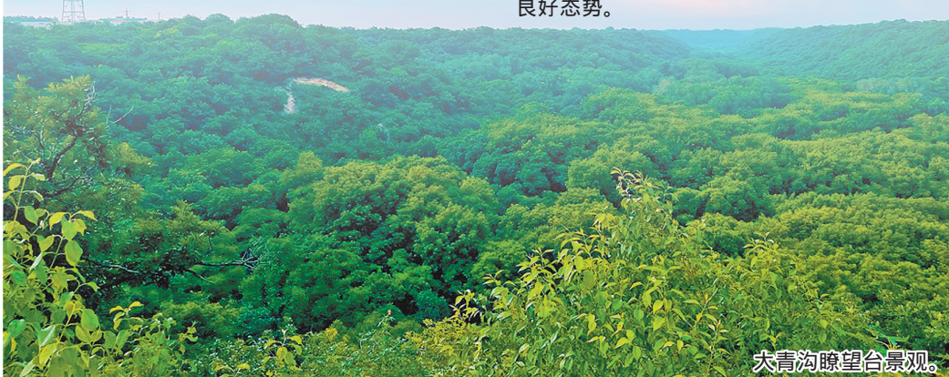
大青沟瞭望台景观。