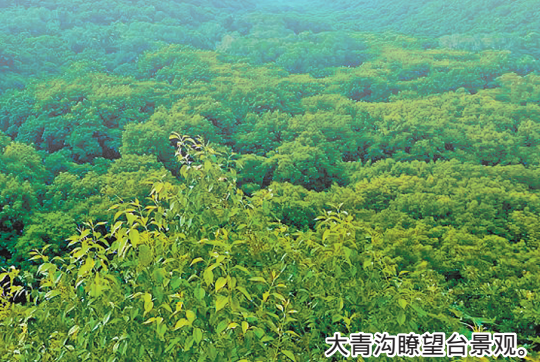
大青沟瞭望台景观。

科左后旗将持续发挥文化旅游资源优势,积极推动文旅融合发展,让文化旅游成为高质量发展的亮丽名片。抓住旅游旺季等有利时机,创新宣传推介方式,激活旅游消费市场,持续打造精品文化旅游项目,发展乡村旅游、优化旅游服务,达到全旗文化旅游产业规模稳步扩大、文化旅游重点项目持续加快、市场体系不断健全、品牌效应日益彰显的良好态势。