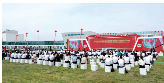
伊利健康谷全球智能制造产业园正式投产。