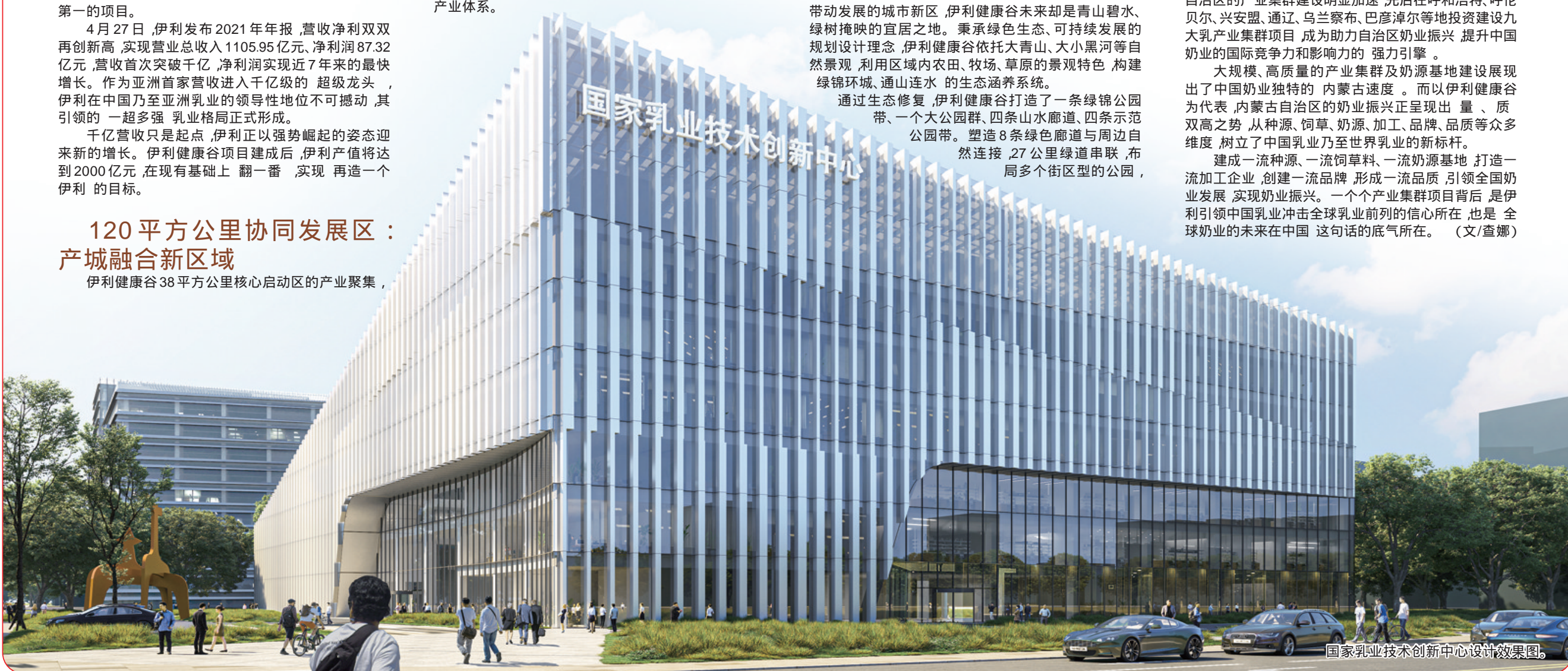
国家乳业技术创新中心设计效果图。

建成一流奶源、一流饲草、一流奶源基地,打造一流加工企业,创建一流品牌,形成一流品质,引领全国奶业发展,实现奶业振兴。一个个产业集群项目背后,是伊利引领中国乳业冲击全球乳业前列的信心所在,也是全球奶业的未来在中国这句话的底气所在。(文/查娜)