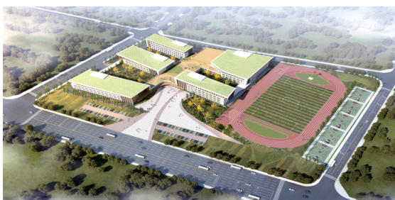
伊利健康谷将建成多所学校,图为校园设计效果图。

政企合力、同频共振。呼和浩特市将依托伊利健康谷的产业集群,规划建设一座城市服务功能完善、职住均衡、生态宜居、智慧便捷的新型智慧城市,推动首府从“中国乳都”迈向“世界乳都”。在这里,我们不仅能看到中国奶业的最高实力水平和国家奶业振兴收获的成果,也能更清晰地读懂全球奶业的未来在中国的大趋势。