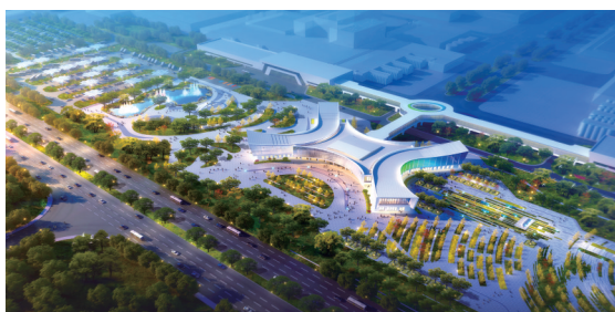
伊利智造体验中心及周边环境设计效果图。