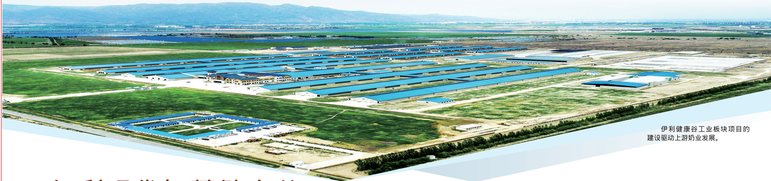
伊利健康谷工业板块项目的建设驱动上游奶业发展。