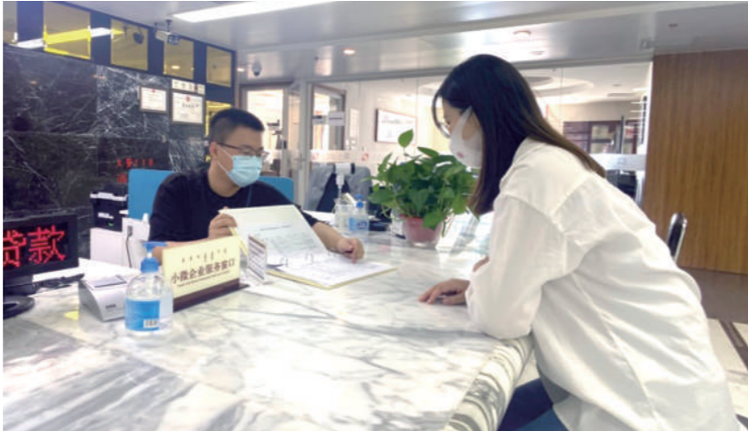
国家开发银行内蒙古分行工作人员向客户宣介减费让利政策。

在人民银行推出支持煤炭清洁高效利用专项再贷款政策后,分行积极争取规模保障、全面对接企业需求、持续加大投放供给,主动让利实体经济,切实用好用足专项政策。上海庙煤电项目,是自治区直属能源企业——内蒙古能源集团承建规模最大的火电机组项目,建成后不仅可促进蒙西地区煤电基地和新能源消纳,还将促进京津冀鲁地区加大对外来电能的需求,对于提升自治区电力系统调峰能力具有重要意义。疫情期间,项目建设一方面要不延期、不停滞,保质保量完成既定任务,另一方面又面临着未投产无收入、建设用款迫切的困难。分行在了解到这一情况后,第一时间赴项目现场调研,快速启动评审,从评审承诺到合同签订、首笔发放,仅用一个月时间完成该项目50亿元一揽子全额承诺,以历史上最低的火电项目利率满足客户用款需求。为最大限度让利客户,降低融资成本,分行又积极争取煤炭清洁高效再利用优惠政策,下调贷款利率,全贷款周期累