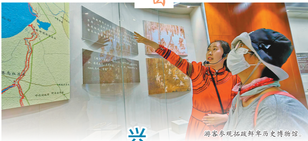
游客参观拓跋鲜卑历史博物馆。