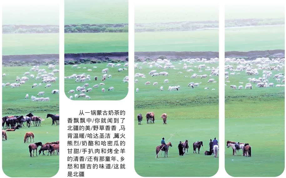
从一锅蒙古奶茶的香飘中/你就闻到了北疆的美/野草香香,马背温暖/哈达圣洁,篝火熊熊/奶酪和哈密瓜的甘甜/手扒肉和烤全羊的清香/还有那童年、乡愁和额吉的味道/这就是北疆

内蒙古诗人定伯的诗集《壮美北疆》,就是边地诗情的极好写照,是一次艰辛的精神探索和思想旅行。诗人在边地披沙拣金,跋涉荒芜,追寻古道,抚摸历史的阳光和风雨,以自己的感悟,邂逅边地文化符号背后的精神文化意义,体验生命的磨砺与锻造。在《壮美北疆》(汉语版)这首诗中,定伯写到,从成吉思汗勒马驻足远眺/情不自禁落下马鞭的瞬间/你就看到了北疆的美/边塞异域风情独特的满洲里/拥吻天边的呼伦贝尔大草原/如梦如幻的阿尔山/积淀和承载几千年文明的河套平原/会唱歌的神奇响沙湾/绵延的沙漠戈壁和绿荫林海。作者从边地写起,把辽阔无垠的内蒙古大草原,勾勒出诗画的全景,让人心旷神怡。作品从诗人的视角出发,来感受内蒙古的博大和宽广,把成吉思汗、马鞭、满洲里、呼伦贝尔大草原、阿尔山、河套平原、响沙湾、沙漠戈壁和绿荫林海等意象,像串珍珠一样穿连起来,美丽的画面令人遐思无限。从马头琴柄拉动的一刹那/你就听到了北疆的美/万马奔腾齐鸣昭君出塞怀里的琵琶/沙漠中漫步的骆驼唱着温情的呼麦/羊群脖子上系着的铃铛/结成一串串悠长悠长的风铃/牧民雪中的脚步踏出岁月的天籁之音/额尔古纳河流淌出天堂般的漠漠之乐/勒勒车慢悠悠碾出的轻声细语/编织成一首民族团结的优美赞歌。马头琴、昭君出塞、骆驼、呼麦、铃铛、勒勒车,诗情画意地传达了内蒙古独特的风情和人文情怀。