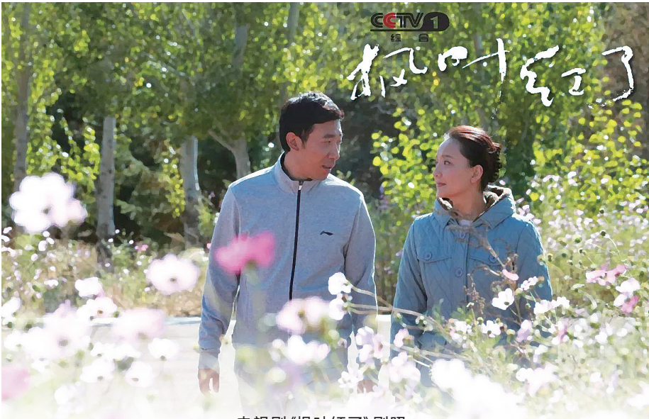
电视剧《枫叶红了》剧照。

那么,因懒致贫的根源又在哪里呢?在这部剧作中,既懒惰又想钻政策空子的典型人物就是那个叫七十三的夫妇俩。从衣着上看,虽然不是破衣烂衫,却也是衣帽不整,从居住环境看,快塌倒的房子从来不修,却一心想借扶贫政策给自家盖上120平米的房子,从饭食上看,好不容易吃一次炖羊肉,还是七十三干了缺德事,从高娃公公替别人放牧的羊群里偷的。什么是懒,从文字构成上看,心里敢耍赖,心里有依赖的人,在行为上必做什么都不愿干,所谓好吃懒做就是这类人物的共同特点。七十三是什么人,张志龙的妹夫。依赖,靠着大树好乘凉,是七十三夫妇永远说不出口却牢牢记藏在潜意识里的心理优势。因此,七十三才会助纣为虐,让高娃家极为困窘的日子因丢了羊而雪上加霜。至于,张小龙干坏事时处处少不了七十三,观众们也就见怪不怪了。季羨林在涉及到人生观时说