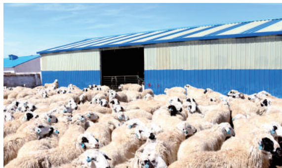
地方优良品种乌珠穆沁种羊场。