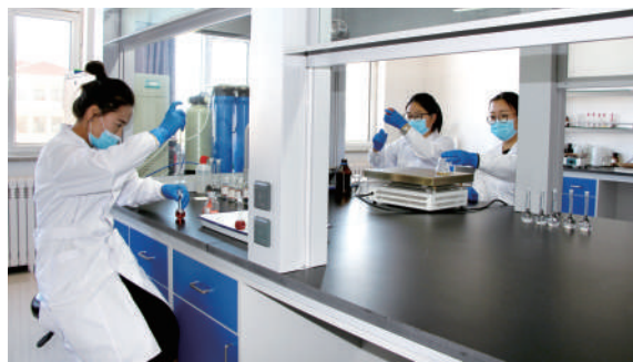
锡林郭勒职业学院理化实验室检测团队。