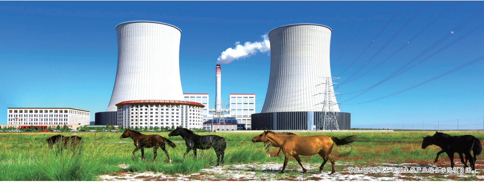
京能正阳发电厂草原生态产业综合示范项目区。