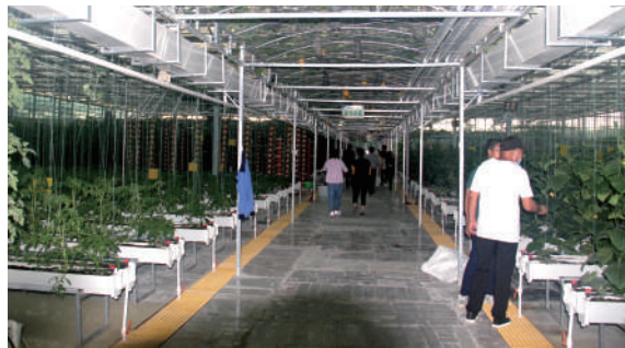
无土栽培技术实验取得成功。