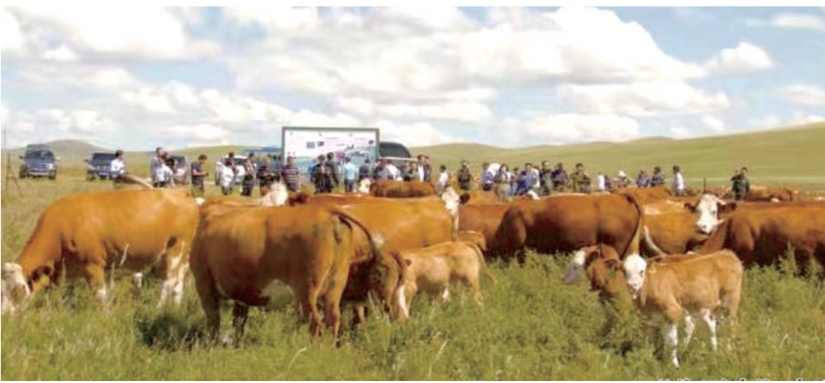
“华西牛”新品系培育成功。

锡林郭勒盟充分发挥企业技术创新主体地位,推动创新要素向企业集聚,积极推进科技型中小企业、高新技术企业“双倍增”行动,对企业创新需求开展了“双调查、双服务”专项行动,全面摸排了企业需求、难点、痛点,一对一