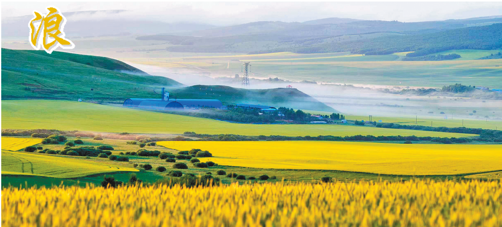
朝雾蒙蒙 新巴尔虎左旗军达盖苏木杜拉尔农场,朝雾蒙蒙,远山含羞,菜花金黄,秀美如画。