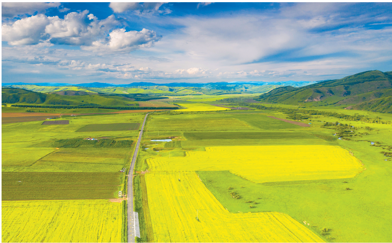
金光熠熠 阿爾山市五岔沟镇,油菜花金光熠熠,与蓝天白云交相辉映。