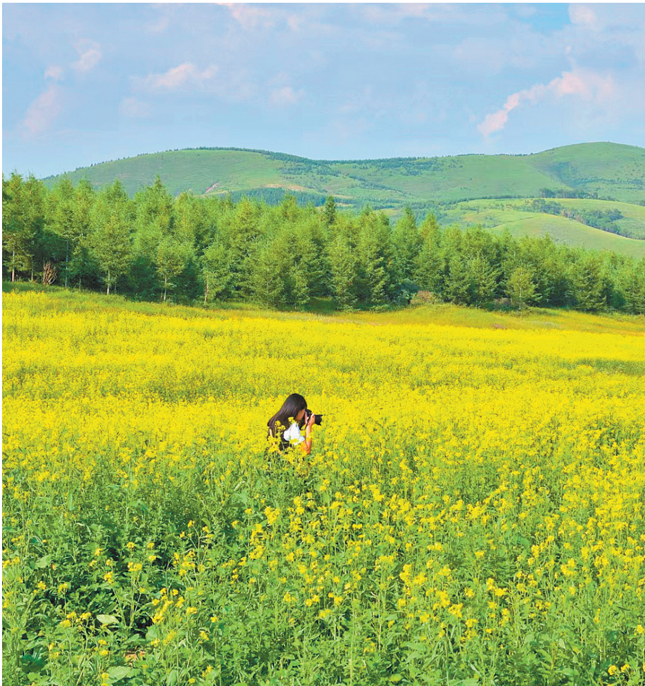
菜花深处觅芬芳 凉城县鸿茅镇白良厂汉村,一位摄影爱好者在油菜花深处拍摄图片。