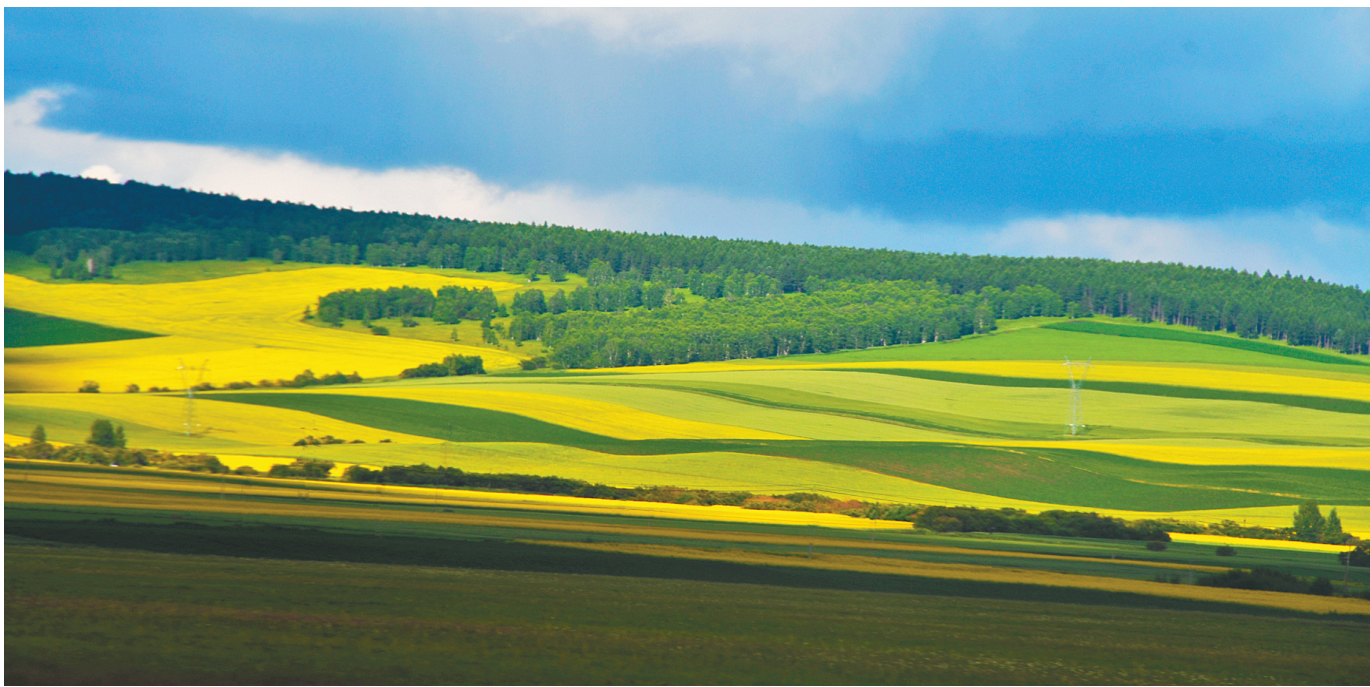
错落有致 牙克石市牧原镇,油菜花田灿若金海,绿树青翠欲滴,错落有致,赏心悦目。