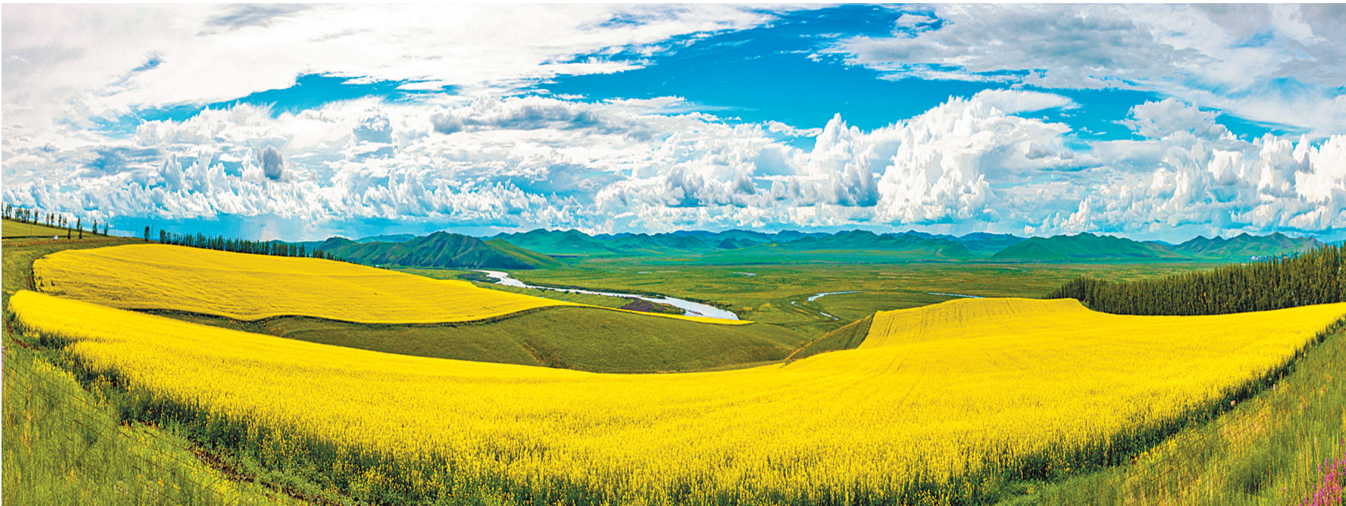
金丝带 额尔古纳市室韦农场,油菜花田宛如金色的丝带,飘向远方。