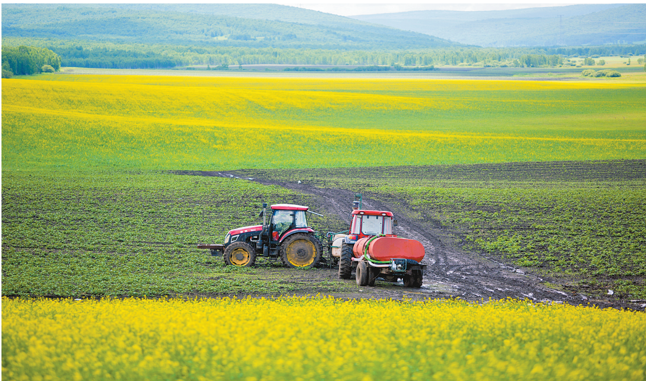
含羞蒙纱 牙克石市免渡河镇,薄雾缥缈,油菜花含羞蒙纱,宛如画卷。 文/图 李世国