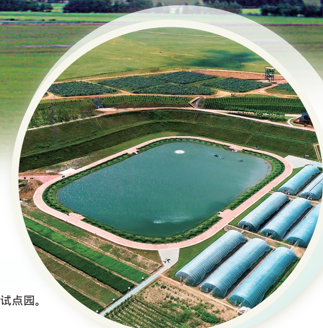
▶产学研中心、试点园。