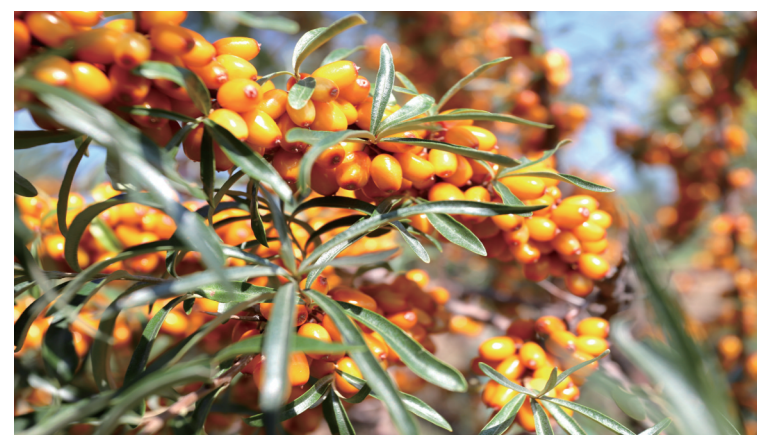
▲边坡及平台沙棘林。