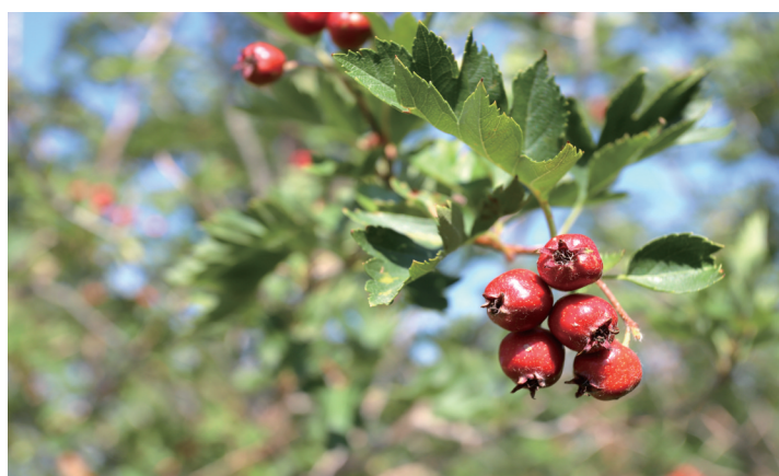
▲引种驯化基地山里红。