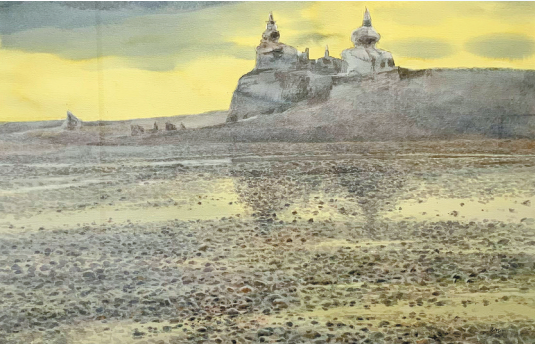
(本文图片为 美丽中国 内蒙古形象主题美术作品展览 参展作品。)

花依旧笑春风》则描绘了呼和浩特桃花盛开的情景,画面桃花怒放,春意盎然,寄寓了画家美好的愿景。侯明的油画《后山村落》浓墨重彩地表现了后山地区新农村的景象。张鹏的油画《雪霁》忠实地再现了北疆雪后初阳的温暖情景。孙与平的油画《茫茫鄂伦春》则表现了雪后鄂伦春的独特风情。马志有的水彩画《驯鹿》通过独特的内容,写实的语言,表现了冬季呼伦贝尔的独特景致。李玉璋的油画《秋色》通过厚重的色彩表现了阴山山脉大青山麓秋天的景色。崔雪冬的油画《云中古城》以近乎抽象的画面,表现了云中古城的历史遗韵。张项军的油画《恩和小镇》采用大刀阔斧的笔触,表现了恩和小镇的独特风姿。谷芳的油画《夏》表现了盛夏