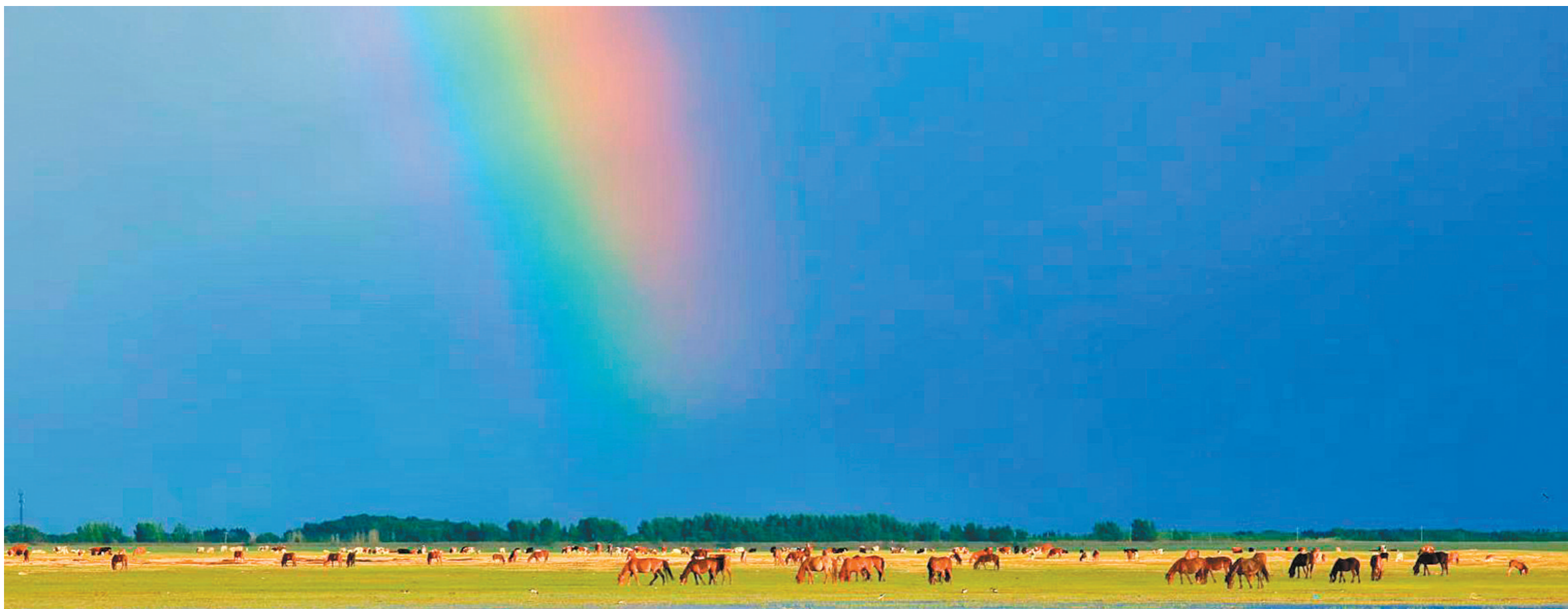
长虹起树杪 扎赉特旗图牧吉镇,树木苍翠,牛马悠然,长虹起于树杪,直挂云天,气势磅礴。