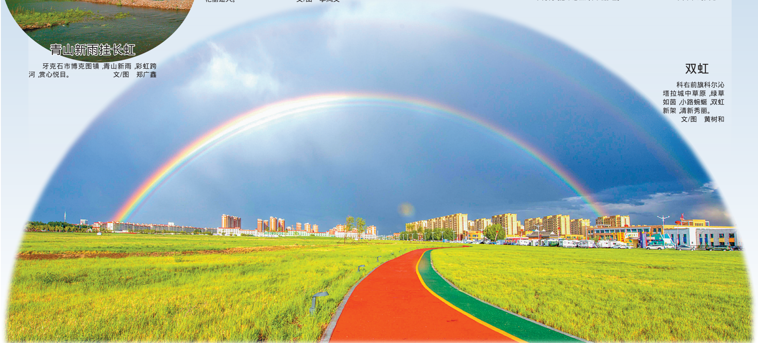
科右前旗科尔沁塔拉城中草原,绿草如茵,小路蜿蜒,双虹新架,清新秀丽。