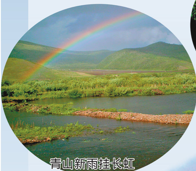
青山新雨挂长虹 牙克石市博克图镇,青山新雨,彩虹跨河,赏心悦目。