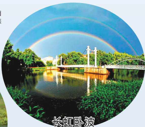
长虹卧波 扎兰屯市吊桥公园,雨后初霁,长虹卧波,艳丽迷人。 文/图 李凤文