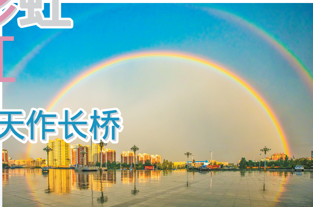
金辉映彩 扎赉特旗音德镇,夕阳乍现,楼宇金辉,双虹新落,宛如幻境。