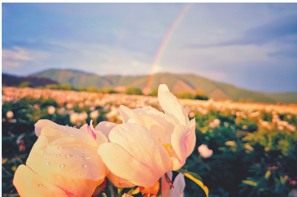
虹插云霄 牙克石市塔尔气镇,芍药花海,含羞带露,瑰丽长虹直插云霄,美景如画。 文/图 任凤杰