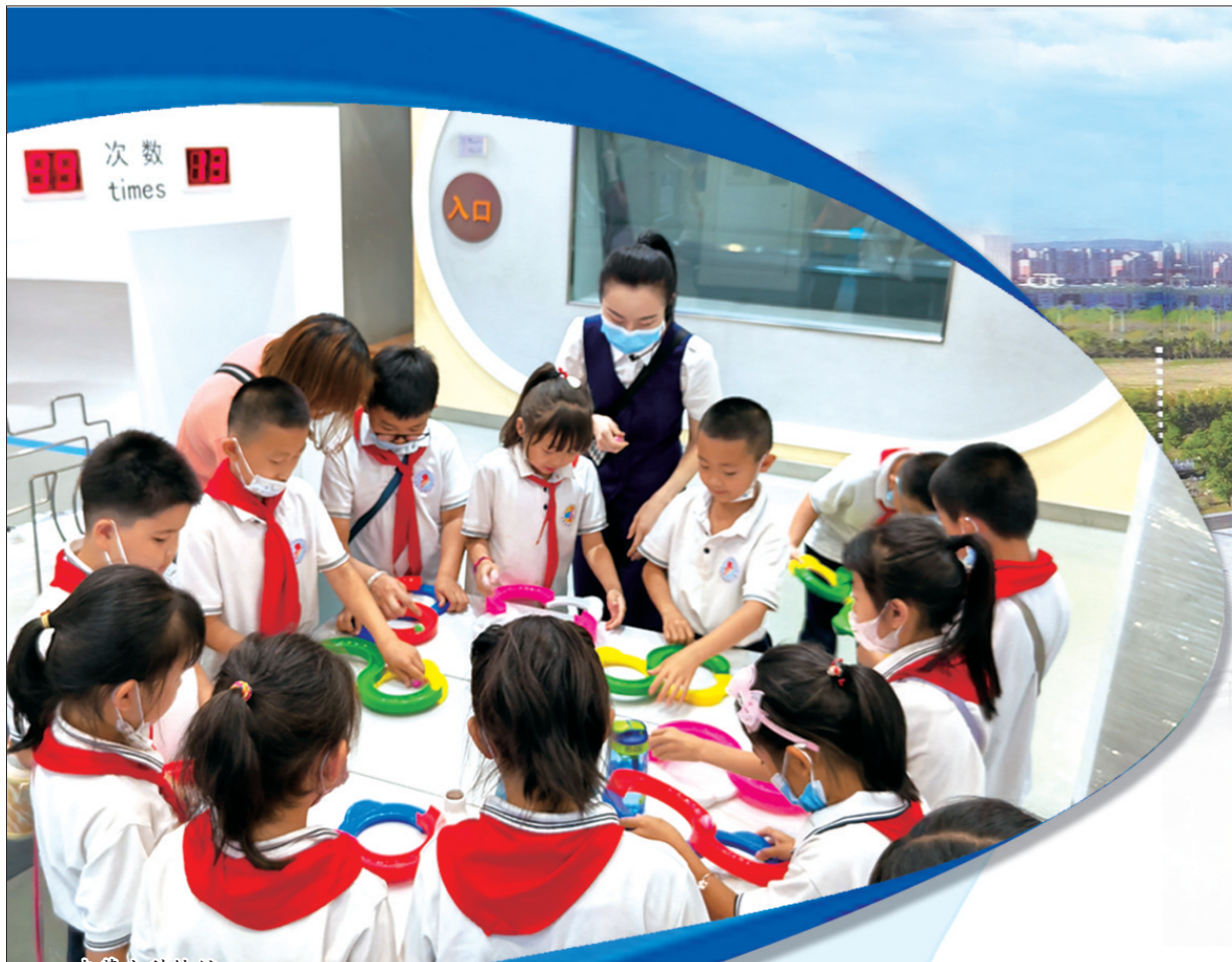
内蒙古科技馆 开展手眼协调科技 教育活动。