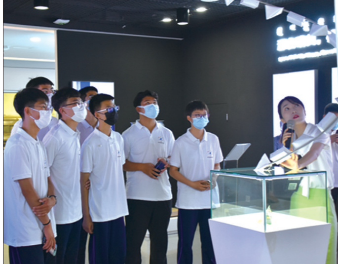
内蒙古科协青少年高校科学营蒙牛乳业分营活动。