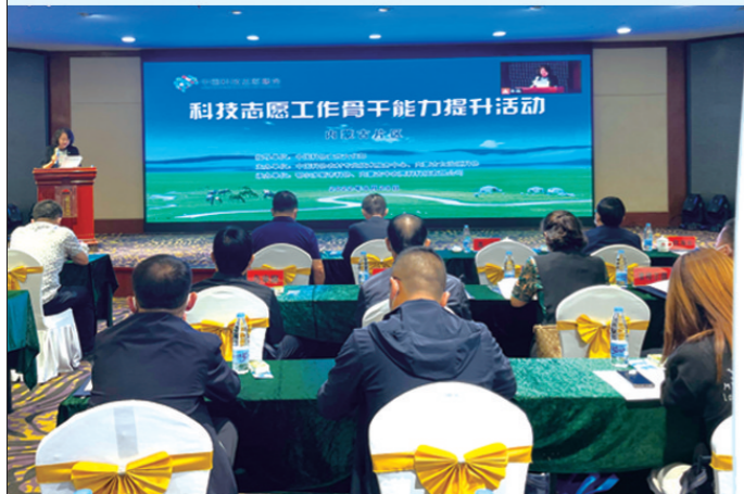
内蒙古科协科技志愿者骨干培训。