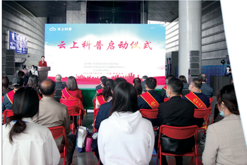
内蒙古科协云上科普APP启动仪式。