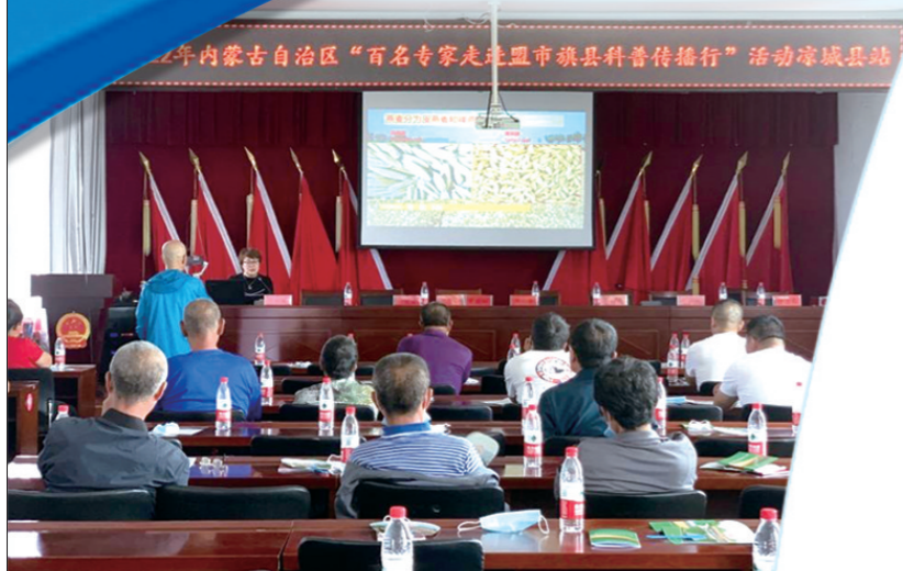
内蒙古科协“百名专家走进盟市旗县科普传播行”活动。

征程万里风正劲,重任千钧再出发。站在新的工作起点上,内蒙古科协将坚持以习近平新时代中国特色社会主义思想为指导,深入学习贯彻习近平总书记关于科技创新、科学普及的重要论述和对内蒙古重要讲话重要指示批示精神,团结带领全区广大科技工作者守望相助、团结奋斗,再接再厉、再鼓干劲,推动我区科普工作实现新发展,为自治区创新发展奠定坚实的公民科学素质基础,以更加强劲的科普之翼助力自治区高质量发展。