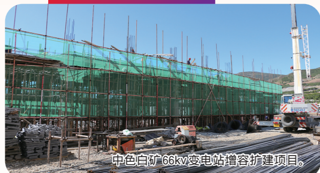
中色白矿66kv变电站扩容扩建项目。

今年,巴林左旗计划实施总投资5000万元以上(社会事业1000万元以上)重点项目46个,总投资规模129.2亿元,年内计划完成投资37.1亿元。目前,已动、开工重点项目46个,开工率100%,完成投资33.9亿元,投资完成率91.3%。