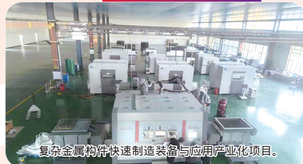
复杂金属构件快速制造装备与应用产业化项目。

今年,红山区计划实施总投资5000万元以上(社会事业1000万元以上)重点项目63个,总投资规模203.2亿元,年内计划完成投资75.3亿元。目前,已动、开工重点项目63个,开工率100%,完成投资65.7亿元,投资完成率87.3%。