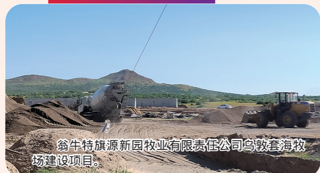
翁牛特旗源新园牧业有限公司乌敦套海牧场建设项目。

今年,翁牛特旗计划实施总投资5000万元以上(社会事业1000万元以上)重点项目51个,总投资规模83.1亿元,年内计划完成投资43.4亿元。目前,已动、开工重点项目51个,开工率100%,完成投资38.2亿元,投资完成率88%。