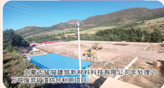
内蒙古猛骏建筑新材料科技有限公司年处理20万吨废弃矿渣综合利用项目。

今年,喀喇沁旗计划实施总投资5000万元以上(社会事业1000万元以上)重点项目35个,总投资规模103.7亿元,年内计划完成投资33.8亿元。目前,已动、开工重点项目35个,开工率100%,完成投资27.7亿元,投资完成率82%。