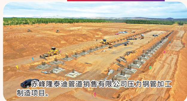
赤峰隆泰管道销售有限公司压力钢管加工制造项目。

今年,敖汉旗计划实施总投资5000万元以上(社会事业1000万元以上)重点项目36个,总投资规模104亿元,年内计划完成投资25.1亿元。目前,已动、开工重点项目36个,开工率100%,完成投资22.4亿元,投资完成率89.2%。