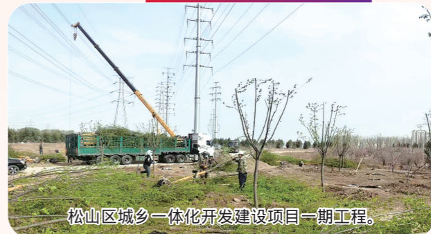
松山区城乡一体化开发建设项目一期工程。

今年,松山区计划实施总投资5000万元以上(社会事业1000万元以上)重点项目45个,总投资规模241.6亿元,年内计划完成投资63.7亿元。目前,已动、开工重点项目45个,开工率100%,完成投资59.8亿元,投资完成率93.9%。