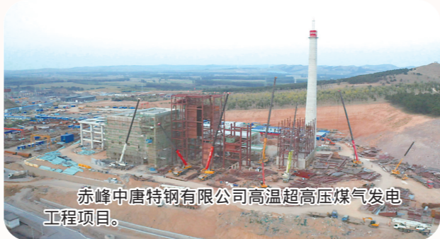
赤峰中唐特钢有限公司高温超高压煤气发电工程项目。

今年,宁城县计划实施总投资5000万元以上(社会事业1000万元以上)重点项目72个,总投资规模347.2亿元,年内计划完成投资112.3亿元。目前,已动、开工重点项目72个,开工率100%,完成投资104.6亿元,投资完成率93.1%。