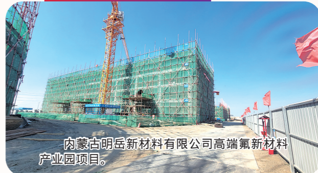
内蒙古明岳新材料有限公司高端氟新材料产业园项目。

今年,由高新区东山产业园纳入管理的总投资5000万元以上(社会事业1000万元以上)重点项目共11个,其中8个项目在旗县区统计,3个项目在市级统计,市级项目总投资规模41亿元,年内计划完成投资5.1亿元。目前,已动、开工重点项目2个,完成投资1.76亿元。