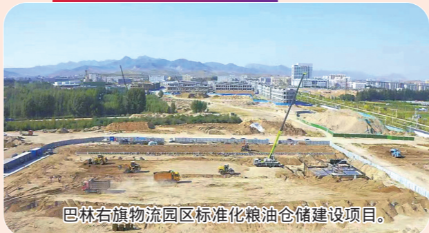
巴林右旗物流园区标准化粮油仓储建设项目。

今年,巴林右旗计划实施总投资5000万元以上(社会事业1000万元以上)重点项目31个,总投资规模64.8亿元,年内计划完成投资21.5亿元。目前,已动、开工重点项目31个,开工率100%,完成投资17.6亿元,投资完成率82%。