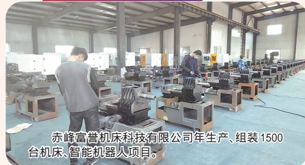
赤峰富誉机床科技有限公司年生产、组装1500台机床、智能机器人项目。

今年,元宝山区计划实施5000万元以上重点项目90个,总投资规模409.4亿元,年内计划完成投资93.4亿元。目前,已动、开工重点项目90个,开工率100%,完成投资42.4亿元,投资完成率45.4%。