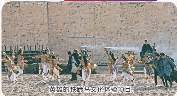
英雄的铁蹄马文化体验项目。

今年,克什克腾旗计划实施总投资5000万元以上(社会事业1000万元以上)重点项目48个,总投资规模265.6亿元,年内计划完成投资55.7亿元。目前,已动、开工重点项目48个,开工率100%,完成投资49.2亿元,投资完成率88.2%。