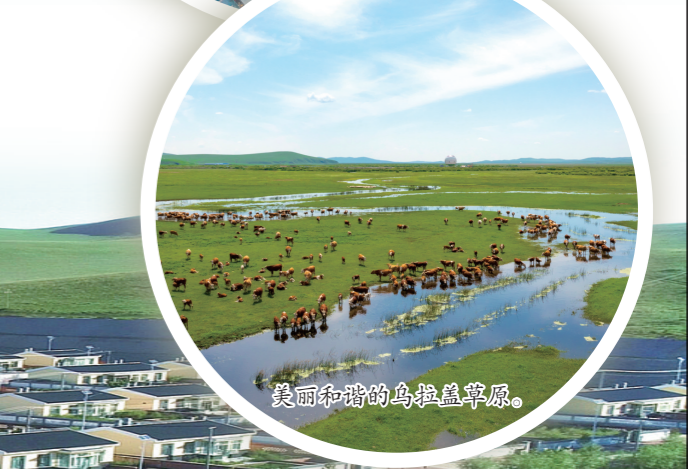
美丽和谐的乌拉盖草原。