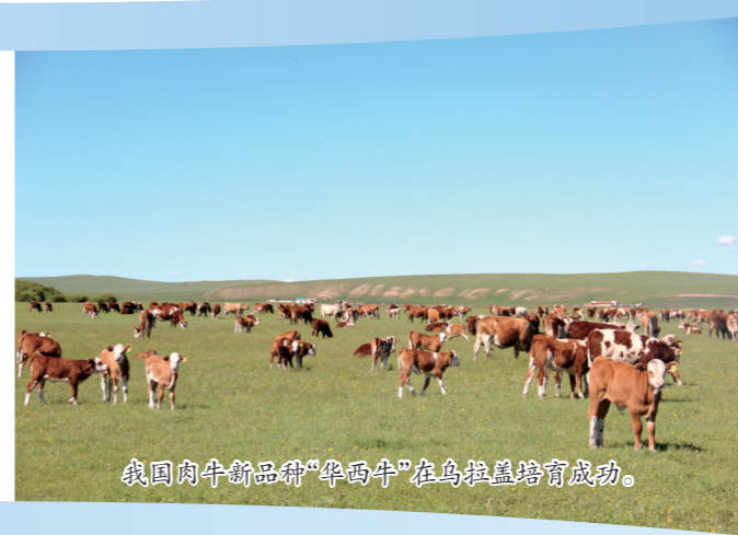
我国肉牛新品种“华西牛”在乌拉盖培育成功。