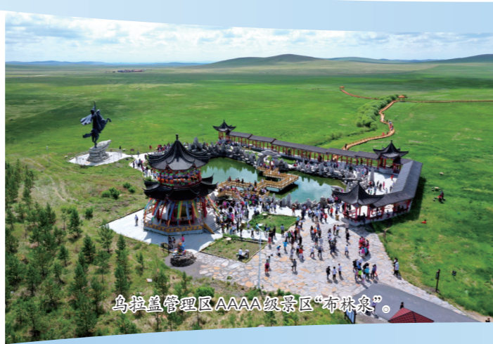
乌拉盖管理区AAAA级景区“布林泉”。