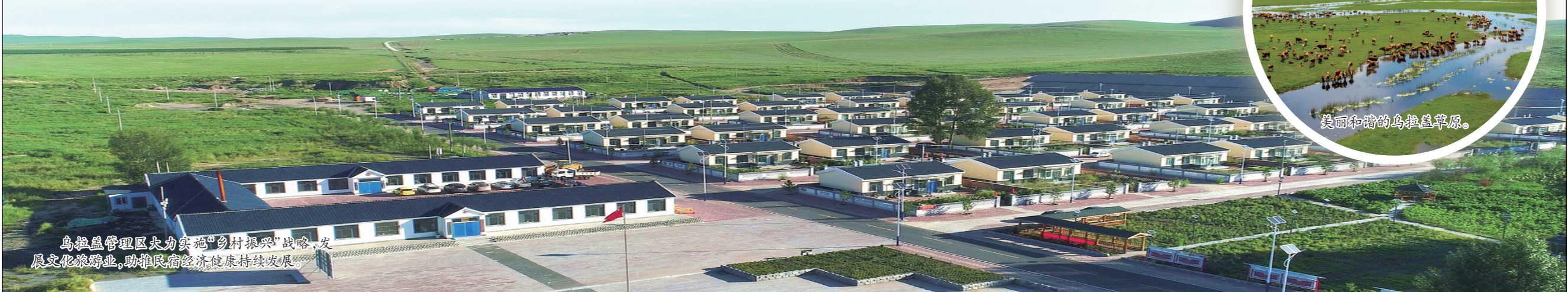
乌拉盖管理区大力实施“乡村振兴”战略,发展文化旅游业,助推民俗经济健康持续发展。