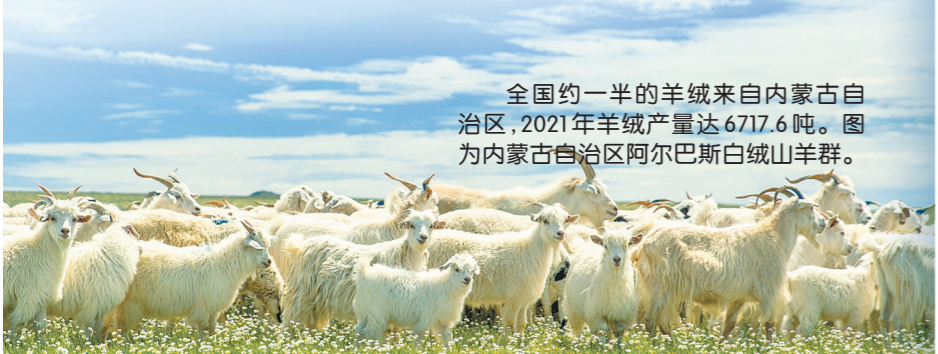
全国约一半的羊绒来自内蒙古自治区,2021年羊绒产量达6717.6吨。图为内蒙古自治区阿尔巴斯白绒山羊群。