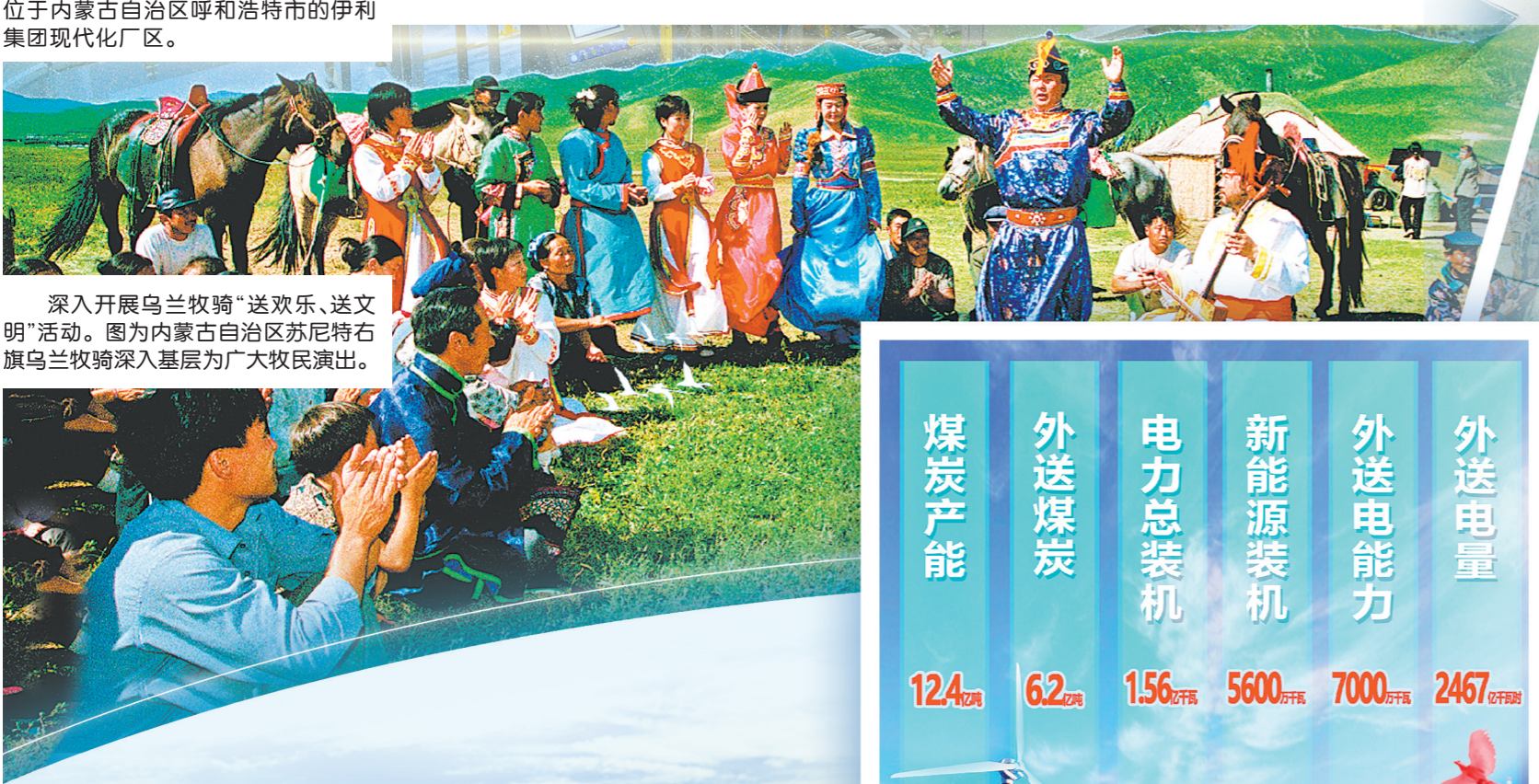
深入开展乌兰牧骑“送欢乐、送文明”活动。图为内蒙古自治区苏尼特右旗乌兰牧骑深入基层为广大牧民演出。