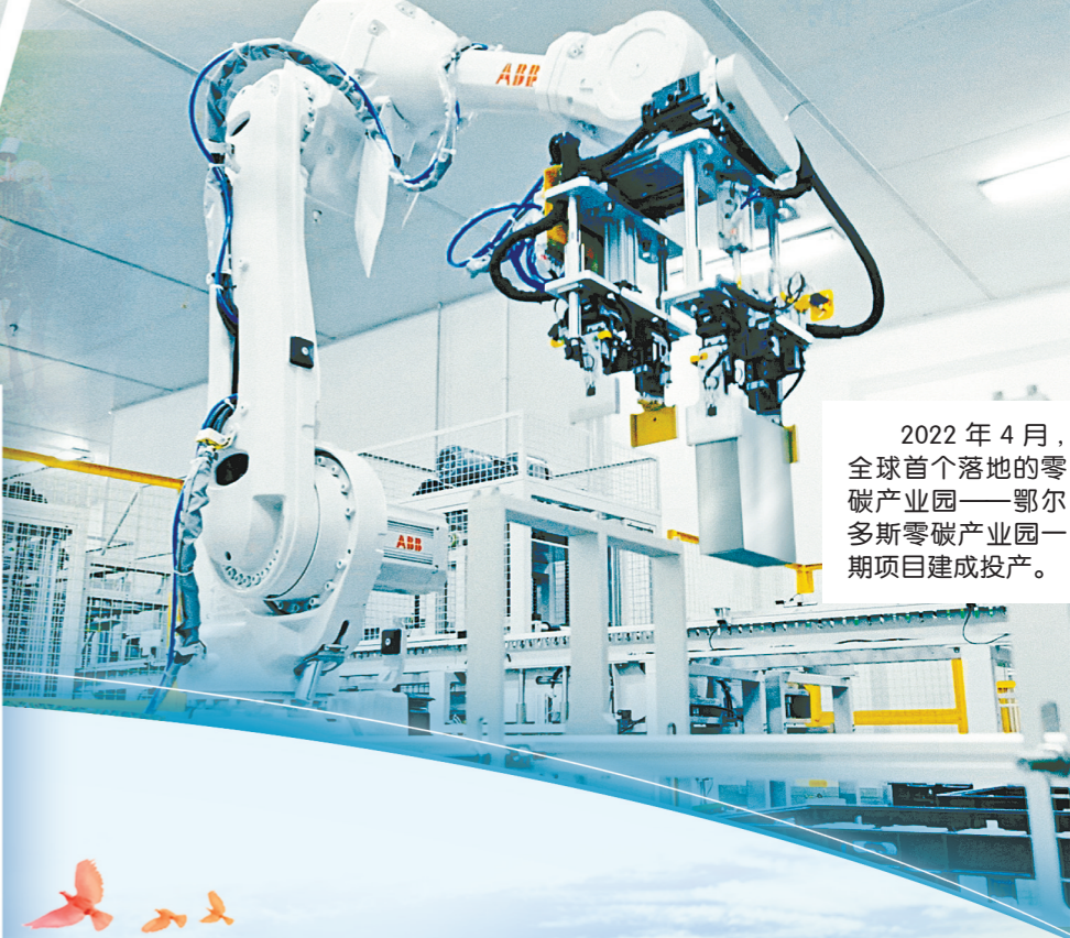
2022年4月,全球首个落地的零碳产业园——鄂尔多斯零碳产业园一期项目建成投产。