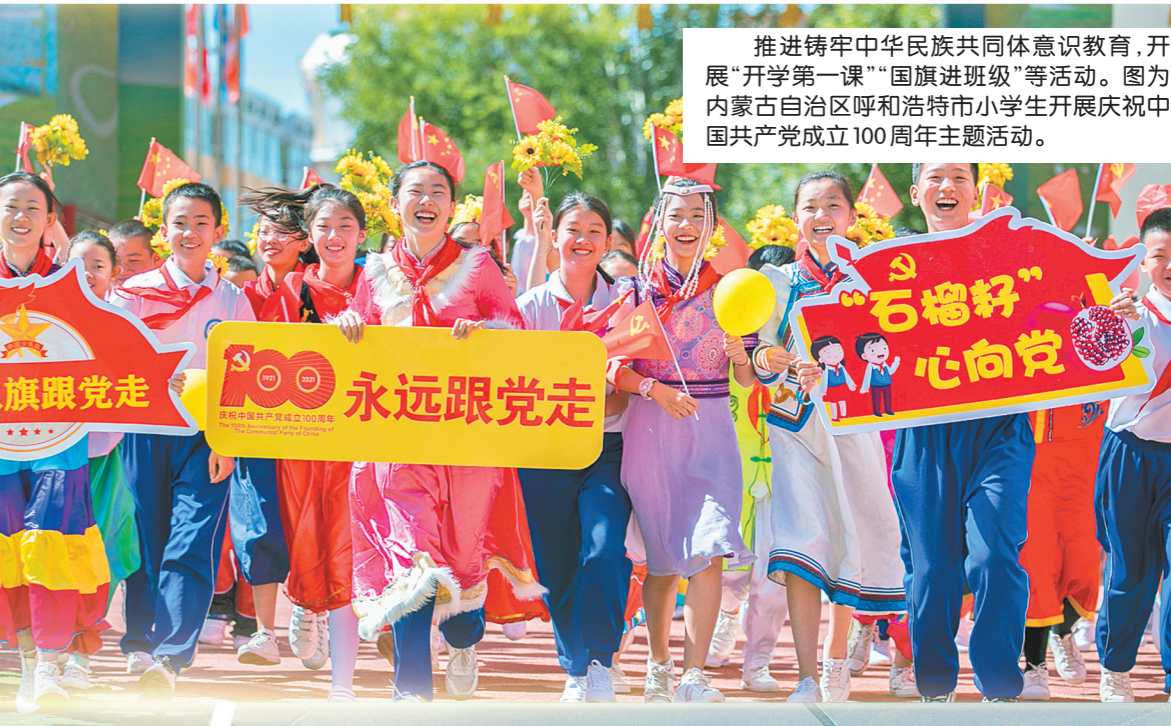
推进铸牢中华民族共同体意识教育,开展“开学第一课”“国旗进班级”等活动。图为内蒙古自治区呼和浩特市小学生开展庆祝中国共产党100周年主题活动。