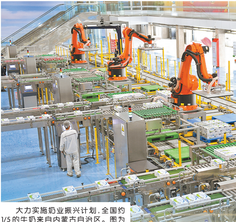
大力实施奶业振兴计划,全国约1/5的牛奶来自内蒙古自治区。图为位于内蒙古自治区呼和浩特市伊利集团现代化厂区。