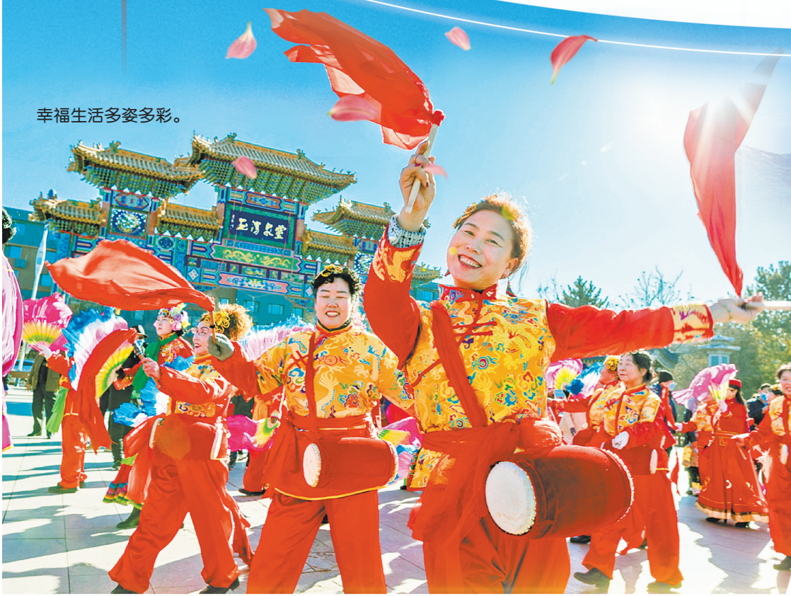
幸福生活多姿多彩。