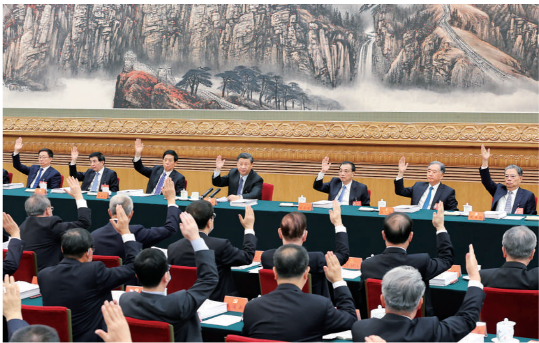
10月21日，中国共产党第二十次全国代表大会主席团在北京人民大会堂举行第三次会议。习近平、李克强、栗战书、汪洋、王沪宁、赵乐际、韩正等出席会议。

新华社北京10月21日电 中国共产党第二十次全国代表大会主席团21日上午在人民大会堂举行第三次会议，通过二十届中央委员会委员、候补委员和中央纪委委员候选人名单(草案)，提交各代表团酝酿。 习近平同志主持会议。 会议通过了各代表团差额预选产生的二十届中央委员会委员、候补委员和中央纪委