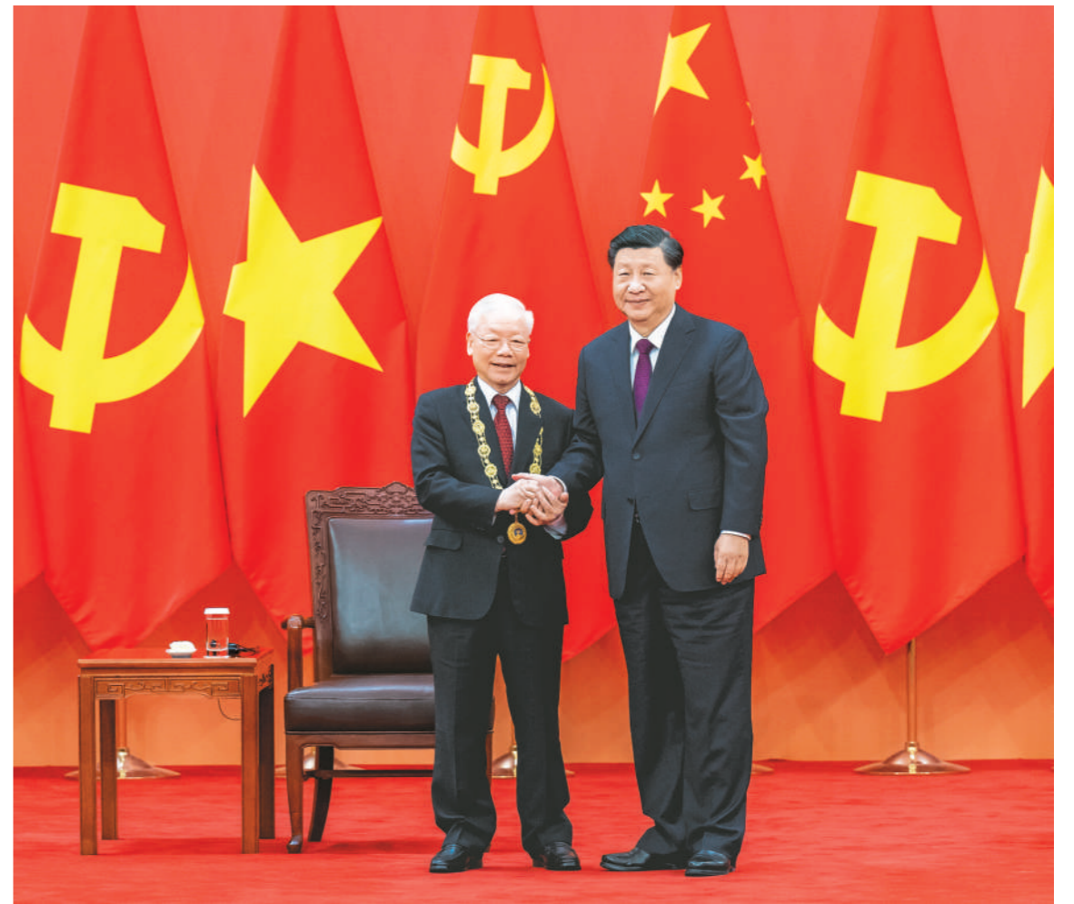
十月三十一日,中共中央总书记、国家主席习近平在北京人民大会堂向越共中央总书记阮富仲授予中华人民共和国“友谊勋章”,并举行隆重颁授仪式。

新华社北京10月31日电 10月31日,中共中央总书记、国家主席习近平在北京人民大会堂向越共中央总书记阮富仲授予中华人民共和国“友谊勋章”,并举行隆重颁授仪式。