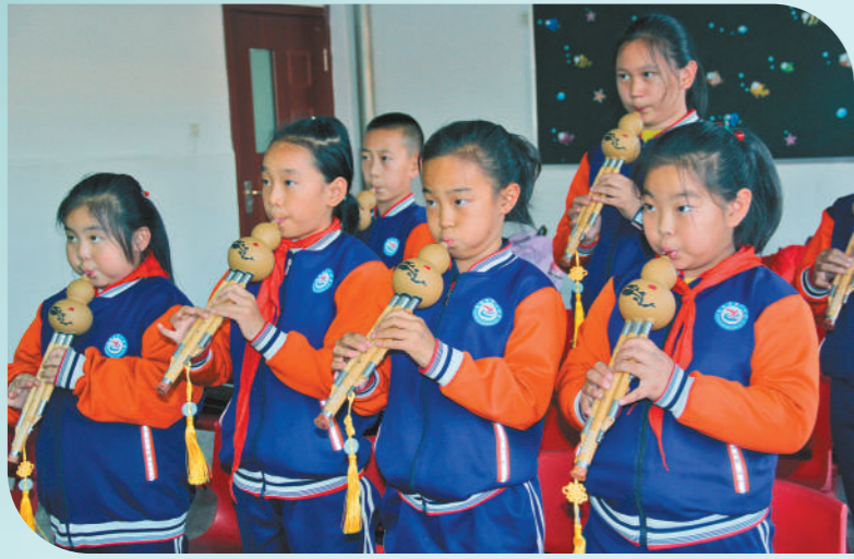
乌海市海南区第一小学学生利用课后服务时间学习葫芦丝。乘着“双减”的东风,全区各级各类学校在落实立德树人的根本任务下,努力培养德智体美劳全面发展的社会主义建设者和接班人,将“五育并举”落到实处。