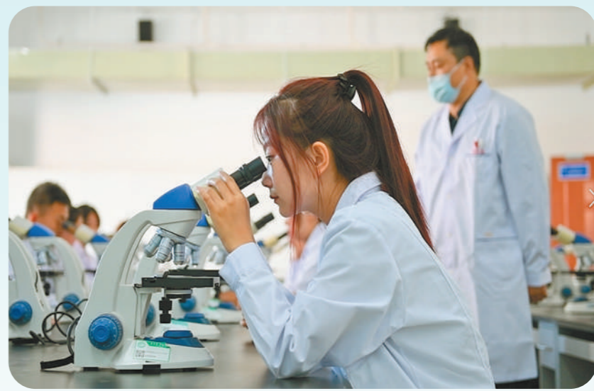
赤峰学院基础医学院的学生正在上组织学与胚胎学课程。十年来,内蒙古高校累计培养118万余名高校毕业生,教育的快速发展,为提升劳动力综合素质、深刻改变国家和民族的精神面貌发挥了重要作用。

一项项政策、一串串数据、一张张笑脸,都是教育公平的阳光洒向内蒙古大地的印记。从“有上学”到“上好学”、从“学有所教”到“学有优教”,办好人民满意的教育,让每个孩子都能享有公平而有质量的教育正在变为现实。