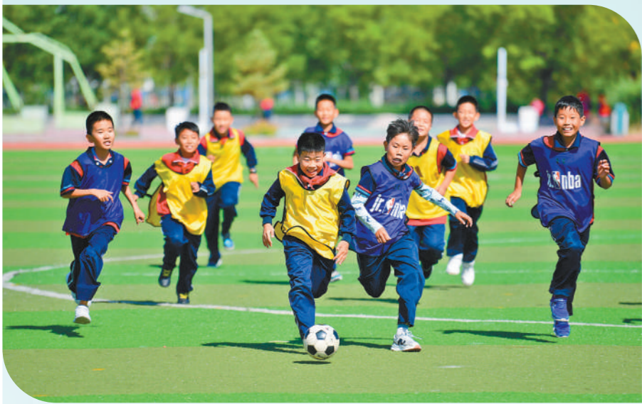
鄂尔多斯市杭锦旗亿利东方学校的小学生们在足球场上积极拼抢。截至今年9月,我区共建成国家级校园足球特色学校1286所,培育了国家级校园足球特色幼儿园446所。教育部认定并命名我区全国青少年校园足球试点县(区)9个,全国青少年校园足球“满天星”训练营名单5个。