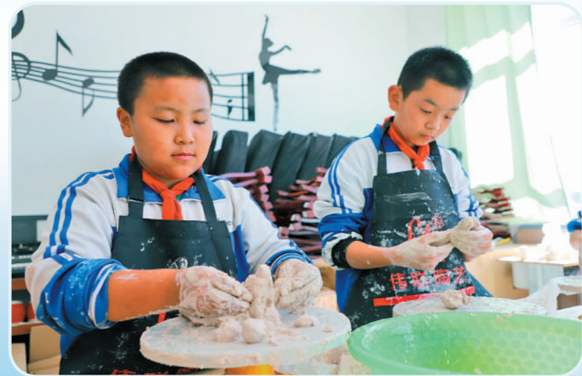
兴安盟突泉县六户中心小学学生在上陶泥课。内蒙古持续推动县域义务教育均衡发展,到2021年,全区中小学体育、音乐、美术、理科实验仪器配备学校达标率达到97%以上,103个旗县(市、区)全域通过国家义务教育发展基本均衡评估认定,正在向优质均衡迈进。