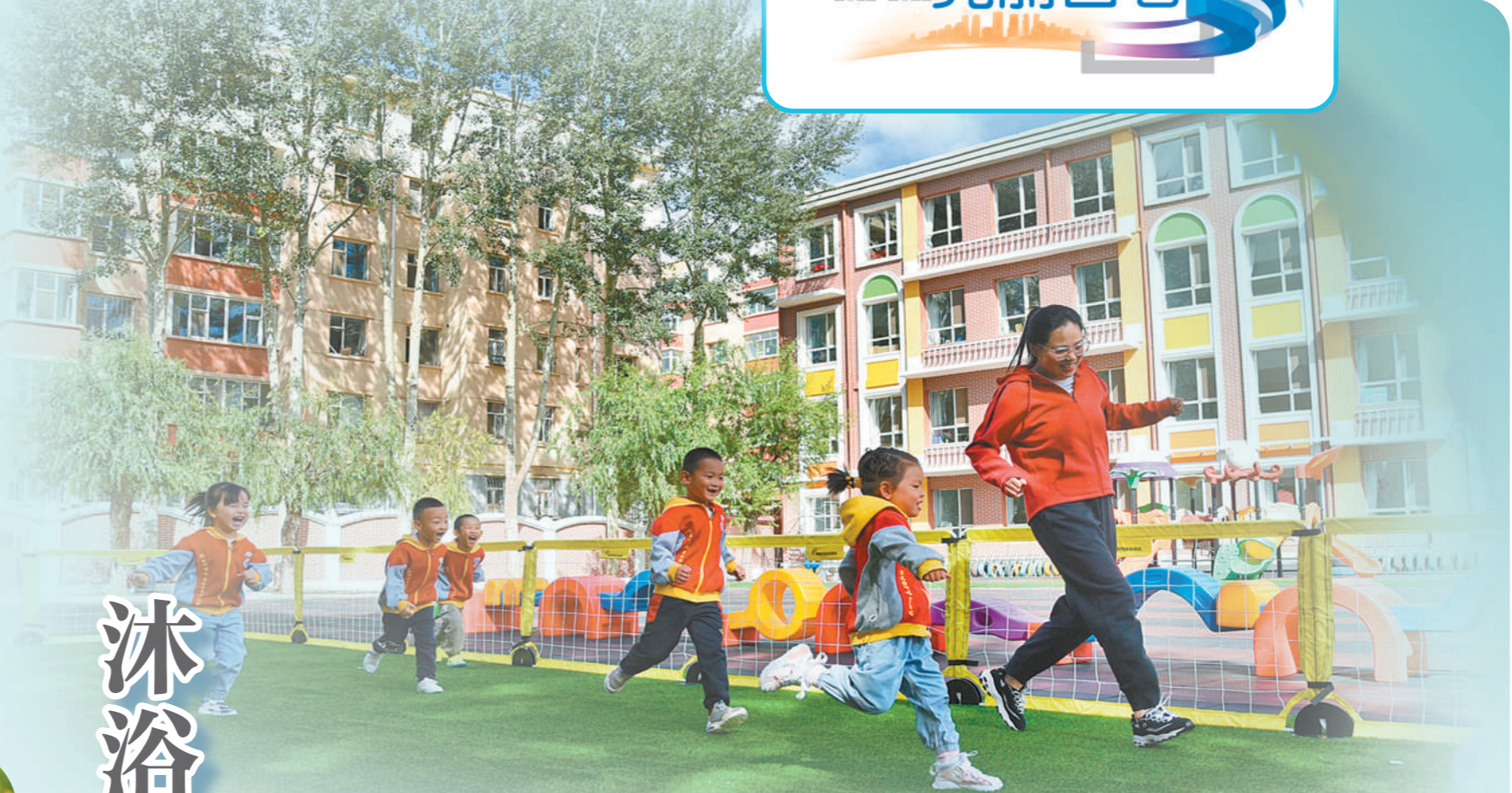
乌兰察布市直属幼儿园教师带领小朋友们在室外进行游戏。十年来,内蒙古大力推进学前教育公益普惠发展,大力发展公办园,积极扶持普惠性民办幼儿园发展,越来越多家庭能够就近享受普惠性学前教育资源。