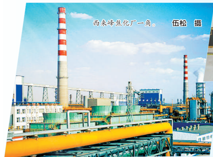
西来峰焦化厂一角。

为保障减免房租工作规范有序开展，包钢坚决落实国家、自治区相关政策要求，对符合减免条件的商户进行摸底排查，明确租金减免对象为承租包钢集团各单位自有经营性房产从事生产经营活动的服务业小微企业和个体工商户，推动减免优惠政策直达商户。同时，包钢组织专人对符合条件的小微企业和个体工商户讲解减免政策，做到应知尽知、应减尽减，以最快速度完成房租减免，进一步提振商户谋求长远发展的信心。特别是2022年以来，包钢积极履行国企社会责任，持续做好房租减免工作，今年已为服务业小微企业和个体工商户减免房租超过1600万元。