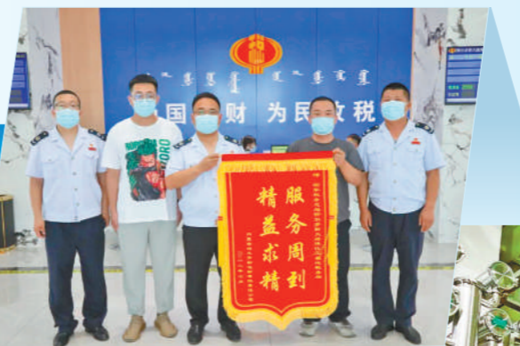
内蒙古昶龙货物运输公司给辖区税务局送来锦旗。