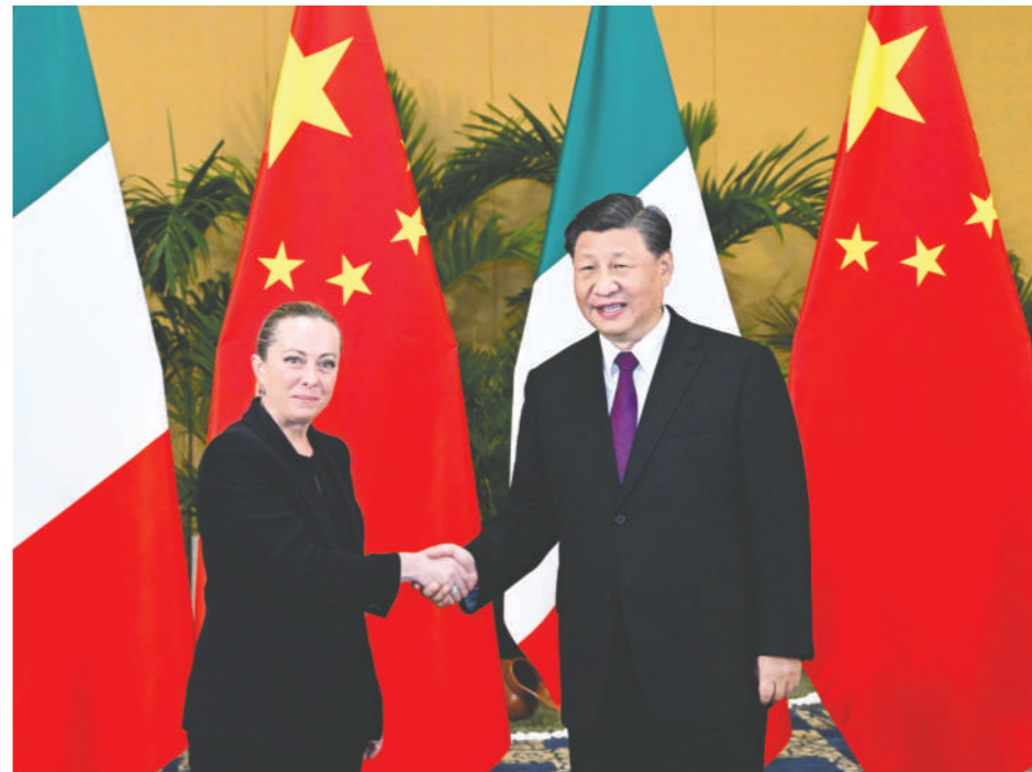
当地时间11月16日晚,国家主席习近平在印度尼西亚巴厘岛会见意大利总理梅洛尼。