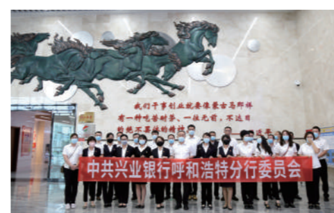
▲兴业银行呼和浩特分行组织党员干部参观廉政教育基地。

持力度,助力解决融资难、融资贵、融资慢等问题,保障区内粮食抢收,确保颗粒归仓。截至10月末,分行涉农贷款余额104.96亿元,较年初增长29.43亿元,全年累计投放55.73亿元。尤其在疫情期间,恰逢秋收关键时刻,兴业银行呼和浩特分行主动了解、对接农户需求,为喀喇沁旗某物资公司投放贷款900万元,为某集团下属6座粮库投放贷款1960万元,为夯实大国粮仓“压舱石”贡献兴业担当。