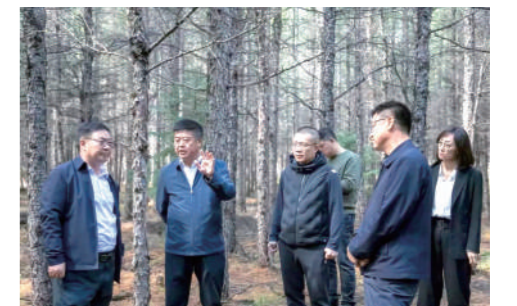
▲兴业银行呼和浩特分行与森工集团开展合作交流对接,并实地调研参观碳汇林基地。

强国蓝图已绘就,勇毅前行正当时。兴业银行呼和浩特分行将以党的二十大精神为指引,认真落实党中央各项决策部署,坚持以发展是第一要务,把服务实体经济作为金融服务主战场,坚决扛起服务内蒙古经济建设大旗。在自治区党委、政府坚强领导下,严格落实总行“1234”战略,巩固基本盘,布局新赛道,坚定不移推进数字化转型,以更高站位、更高标准、更优质量走好新的赶考之路。在新时代、新征程上奋力续写高质量发展新篇章!