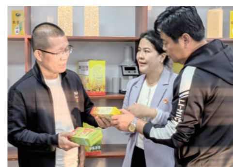
▲兴业银行呼和浩特分行携手大石寨镇,共同助力乡村振兴。

聚焦粮食安全。内蒙古作为国家重要农畜产品生产基地,为保障国家粮食安全作出了重要贡献。兴业银行呼和浩特分行紧紧抓住金融保障粮食安全这个“牛鼻子”,及时掌握涉农资金市场变化,克服区内新冠肺炎疫情反复的不利影响,加大对农业经营主体支