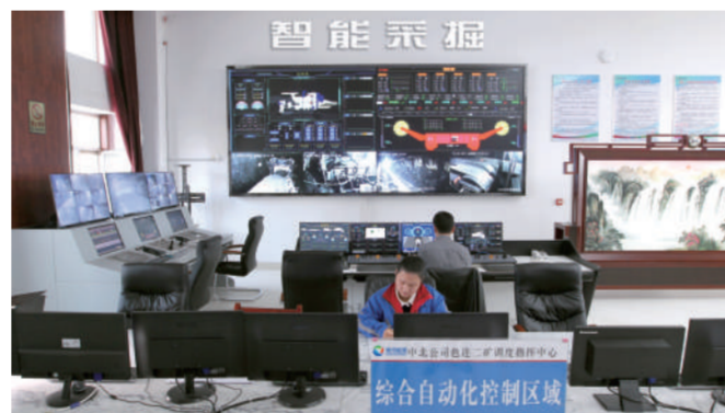
▲图为色连二矿地面智能采煤系统监控、操作系统。