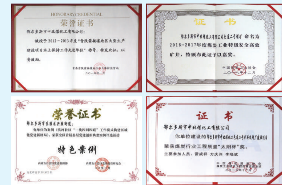
▲图为色连二矿近年荣誉。

金秋九月,从呼和浩特市出发,驱车走进位于鄂尔多斯罕台川流域的鄂尔多斯市中北煤化工有限公司色连二矿,只见矿区周边依然被翠绿所裹挟,道路两旁不时有野兔、野鸡出没。在满眼的绿色中,“建绿色矿山,还山川秀丽”的红色宣传标语格外引人注目。 在打造绿色矿山、铸就智能新时代的进程中,色连二矿深入践行习近平生态文明思想,严格落实黄河流域生态保护和高质量发展重大国家战略,党中央关于碳达峰、碳中和的重大决策,以高度的政治站位擘画未来,走出了一条智能高效、绿色可持续的煤炭资源开发利用新路子。几年来,色连二矿人踔厉奋进、勇毅前行,创造了一个又一个辉煌业绩,仅用三年时间,矿井就从初始设计年产400万吨规模一跃升级为千万吨级现代化矿井,成为蒙西煤电基地的重要一极,被国家有关部门命名为煤炭工业特级安全高效矿井、优质产能矿井,荣获国家级“绿色矿山”,2020年1月8日,色连二矿被国家自然资源部纳入“全国绿色矿山名录”,2020年11月,色连二矿被国家能源局、国家煤矿安全监察局确立为国家首批智能化示范煤矿。先后荣获全国“青年安全生产示范岗”、自治区级“和谐劳动关系单位”、东胜区“安全生产管理先进企业”等荣誉称号,被黄委会授予晋陕蒙地区水土保持工作先进单位。数年间,色连二矿在打造绿色智能矿山的进程中业绩辉煌,成就令人瞩目。