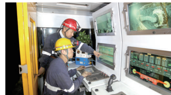
▲图为色连二矿职工在智能化工作面集中控制台操作采煤设备。