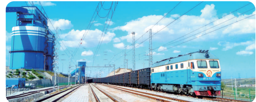
▲图为色连二矿罕台川集运站。