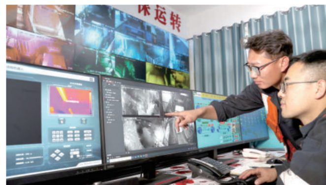
▲图为色连二矿强化巡检管理,确保智能主煤流系统安全稳定运行。