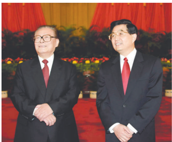
左图:2002年11月15日,江泽民同志、胡锦涛同志在北京人民大会堂亲切会见出席党的十六大代表、特邀代表和列席人员并发表重要讲话。