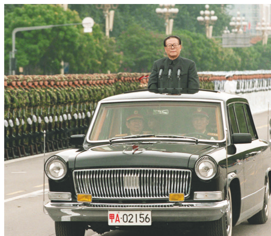
左图:一九九九年十月一日,中华人民共和国成立五十周年盛大庆典在北京天安门广场举行。江泽民同志检阅由人民解放军陆海空三军和人民武装警察部队、民兵预备役部队组成的地面方队。