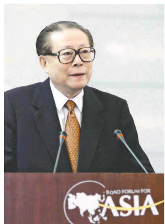
上图:2001年2月27日,博鳌亚洲论坛成立大会在海南举行。江泽民同志出席成立大会并致辞。