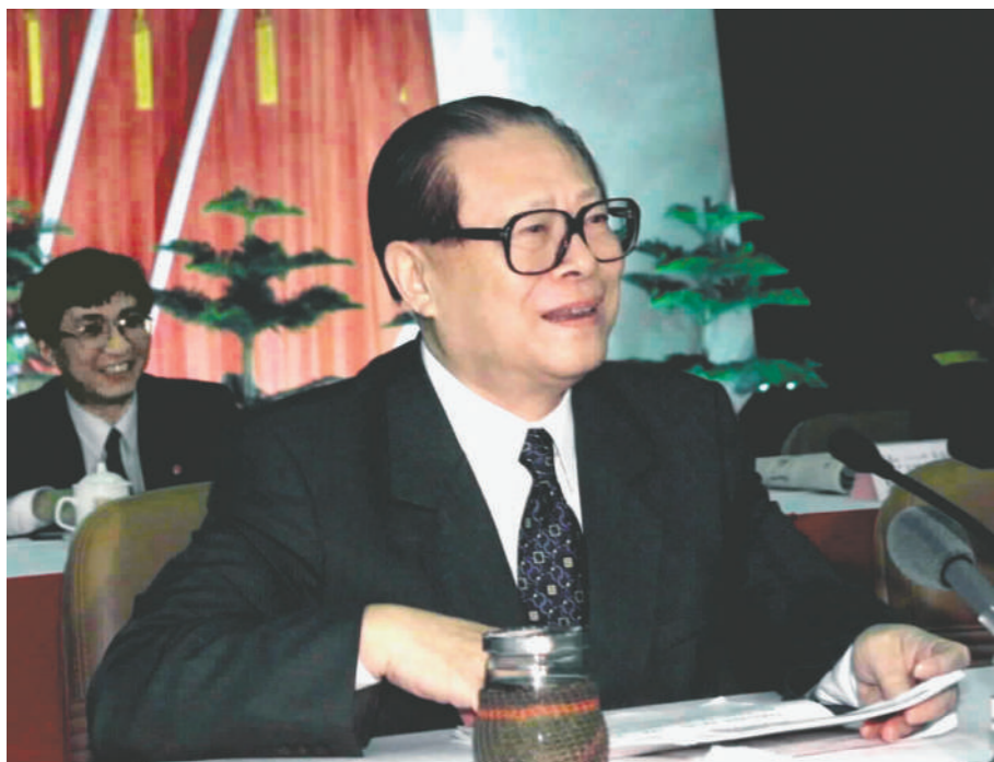
上图:2000年2月20日,江泽民同志在广东省高州市领导干部“三讲”教育会议上发表重要讲话。在这次广东考察中,江泽民同志提出,我们党总是代表着中国先进生产力的发展要求,代表着中国先进文化的前进方向,代表着中国最广大人民的根本利益。