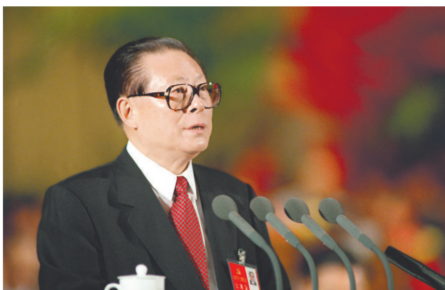
上图:1997年9月12日,中国共产党第十五次全国代表大会在北京人民大会堂开幕。这是江泽民同志代表第十四届中央委员会作报告。