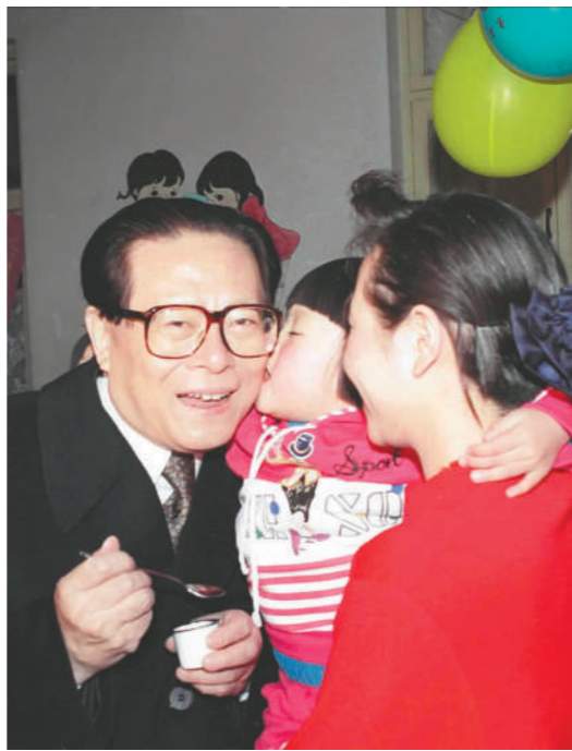
右图:1993年12月5日,江泽民同志在北京为一位幼儿园儿童喂服脊髓灰质炎疫苗后,小朋友亲吻江爷爷。