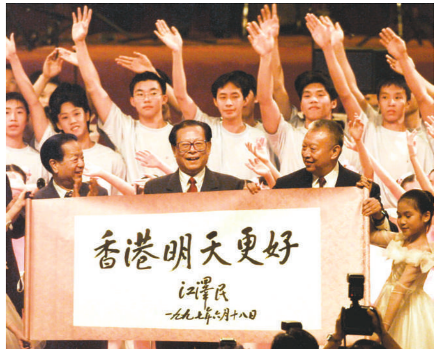
右图:1997年7月1日上午10时,中华人民共和国香港特别行政区成立庆典在香港会展中心新翼举行。在庆典仪式上展示了江泽民同志亲手题写的“香港明天更好”书法卷轴。