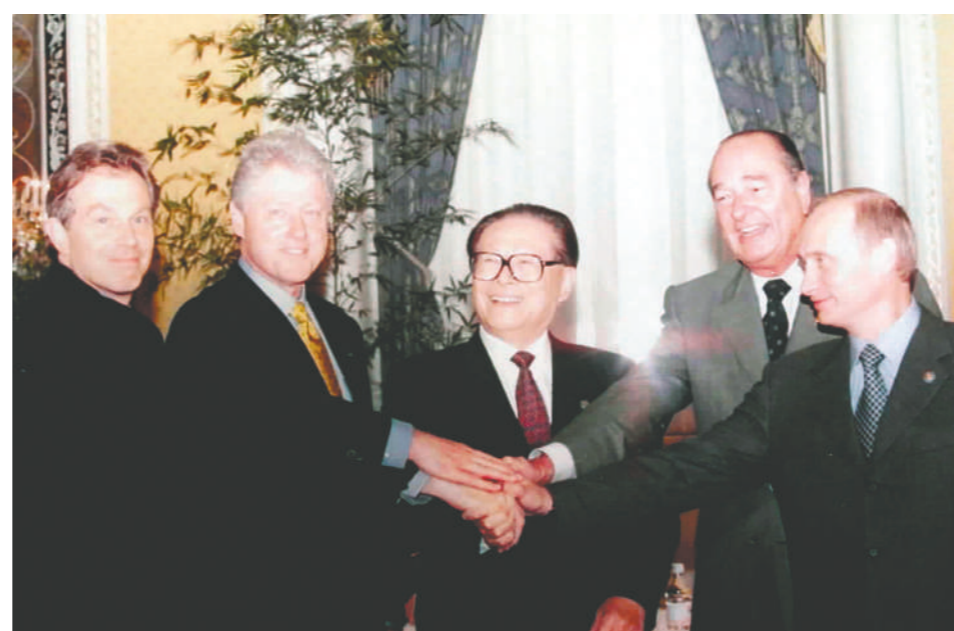
左图:2000年9月7日,由美国倡议的联合国安理会五个常任理事国首脑会议在纽约举行。江泽民同志(中)同法国总统希拉克(右二)、俄罗斯总统普京(右一)、英国首相布莱尔(左一)、美国总统克林顿(左二)握手合影。