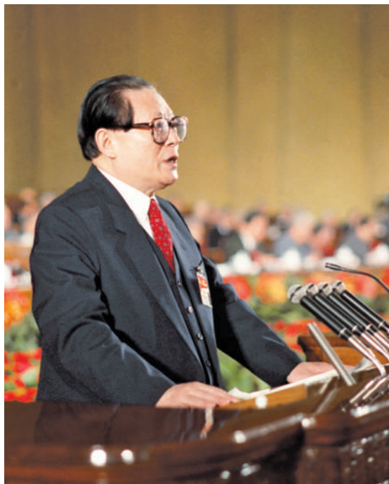
左图:1992年10月12日,中国共产党第十四次全国代表大会在北京人民大会堂开幕。这是江泽民同志代表第十三届中央委员会作报告。