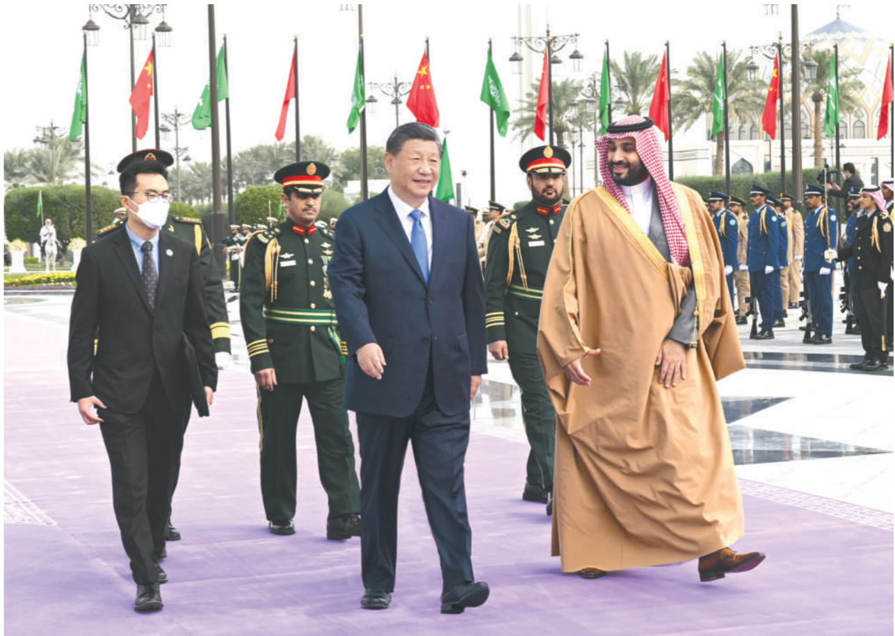
当地时间12月8日中午,沙特王储兼首相穆罕默德代表国王萨勒曼为正在沙特进行国事访问的国家主席习近平在利雅得王宫举行欢迎仪式。