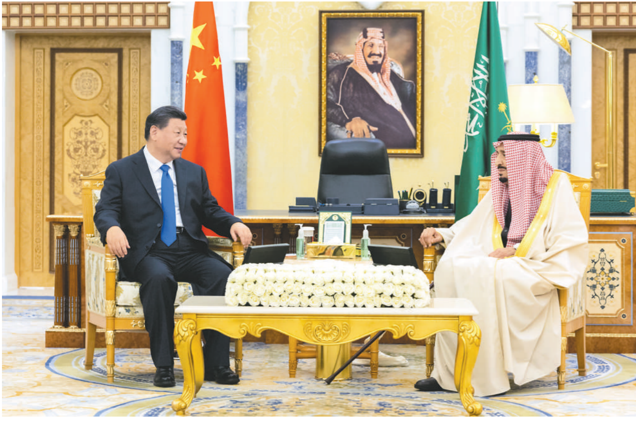
当地时间12月8日下午,国家主席习近平在利雅得王宫会见沙特国王萨勒曼。