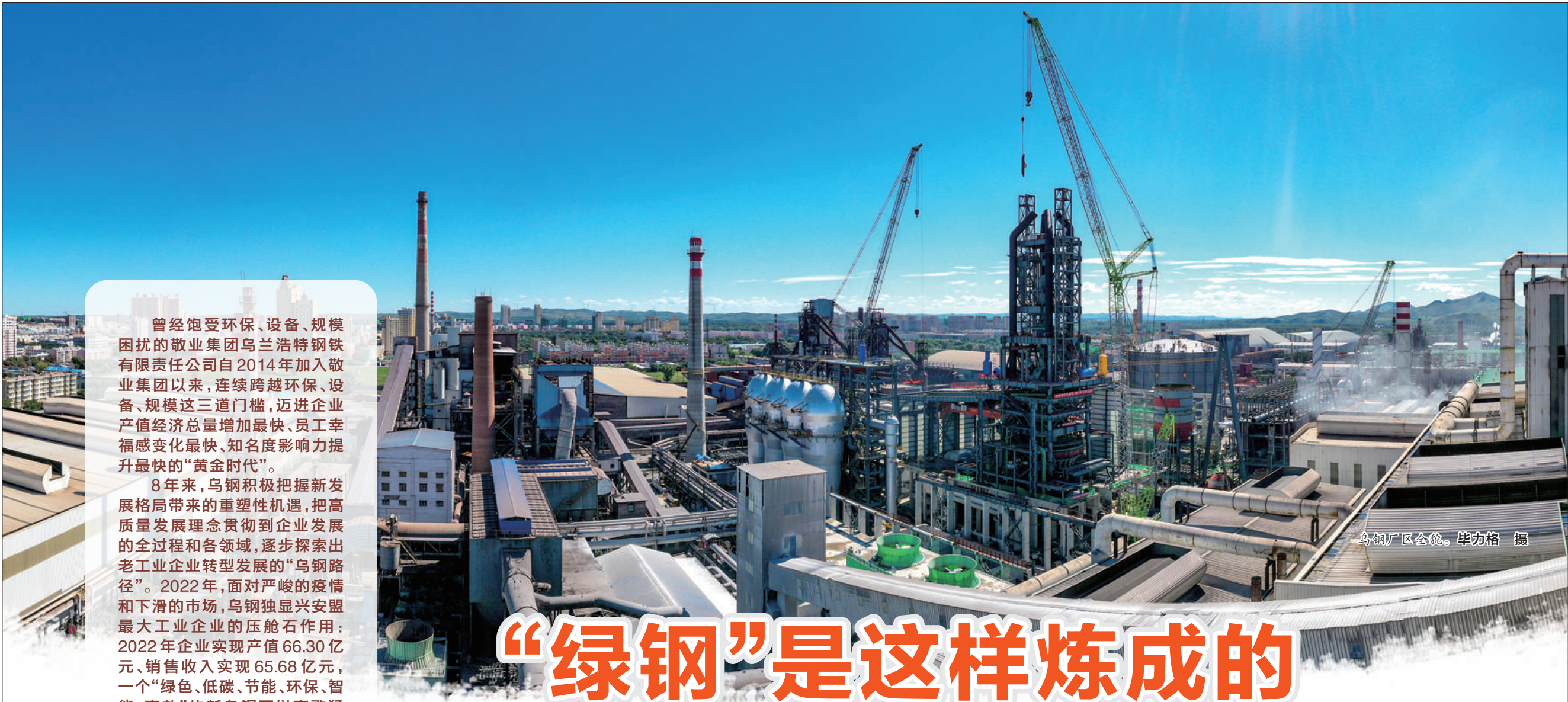
乌钢厂区全景。