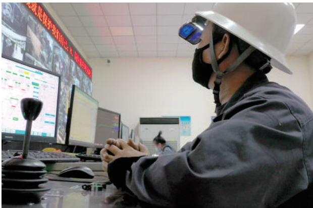
工人在数控室监测数据。

2023年1月4日,漫步在敬业集团乌兰浩特钢铁有限责任公司厂区,整洁的道路、干净的厂区映入眼帘,绿色、节能、环保、高效的现代化钢企已初具规模。在乌钢主干路旁的宣传栏,记者看到了乌钢治理前的老照片,随处堆放的物料,冒烟的烟囱再加上黑黢黢的厂区,与眼前的景象有着天壤之别。