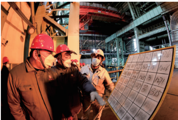
工人们正在车间内忙碌。