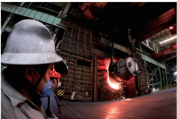
炼钢车间火热生产。

65年前,伴随着第一炉铁水的流出,乌兰浩特钢铁厂正式建成投产,填补兴安盟的重工业空白。