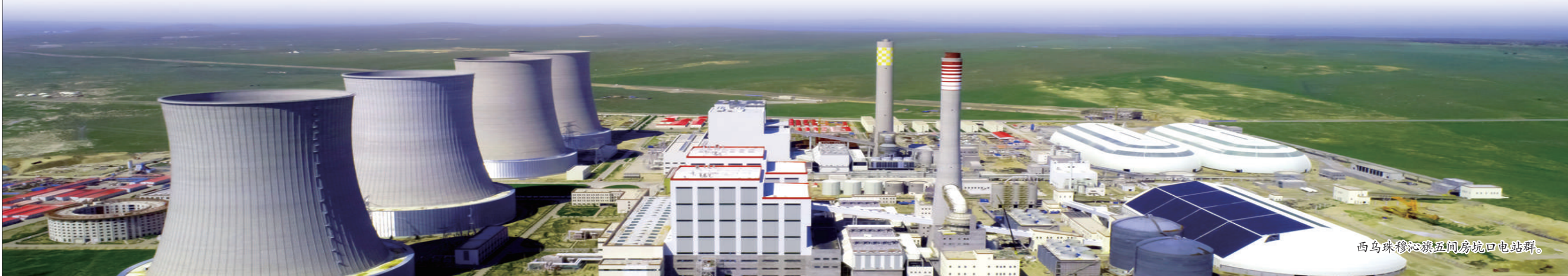
西乌珠穆沁旗五间房坑口电站群。