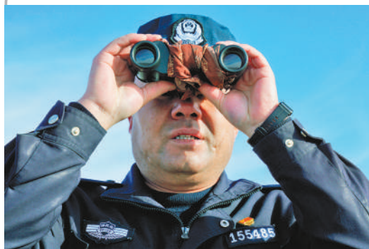
阿古达木所长正在观察周边情况。