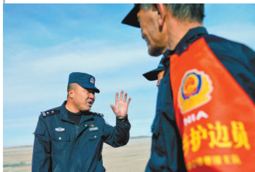
安排护边防控工作。