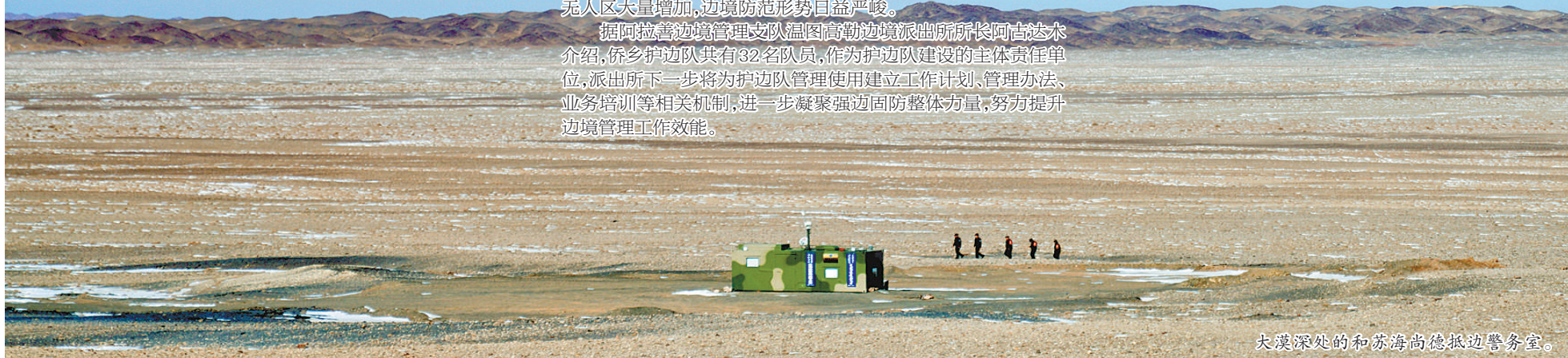
大漠深处的和苏海高德边警务室。