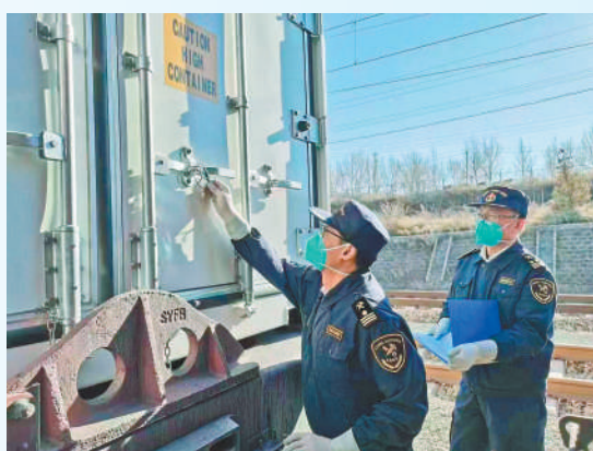
满洲里海关检验检疫人员在货运列车检测中心核对集装箱封志。

2022年6月10日,产值近1500万元、50吨聚偏氟乙烯搭乘中欧班列从乌兰察布发往德国杜伊斯堡。这是乌兰察布本地工业产品首次搭乘中欧班列出口欧洲。