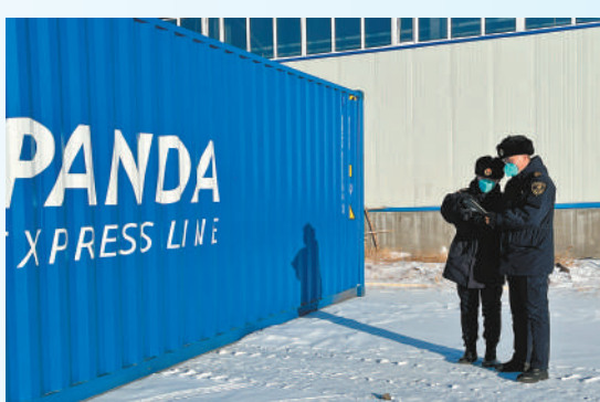
满洲里车站海关查验员对入境集装箱进行现场查验。

丝路兴,天下通。相继开行中欧班列“乌兰察布—阿拉木图”“乌兰察布—莫斯科”“乌兰察布—万象”“乌兰察布—莫斯科”……中欧班列已成为乌兰察布市一张亮丽名片。作为全国首批23个国家物流枢纽和17个中欧班列节点城市之一,乌兰察布市以中欧班列运营为抓手,充分利用区位优势,全面推进向北开放,不断释放口岸和国际通道的辐射带动作用,经济社会发展迸发出更新更强的活力。